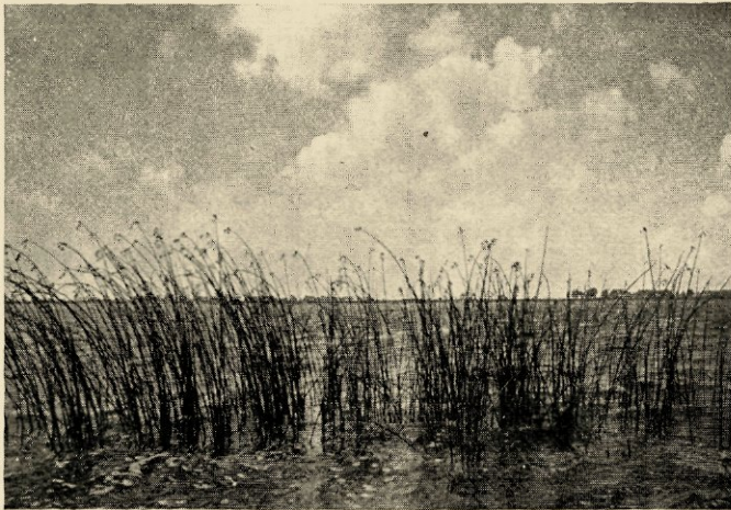
Links van het Oortjespad

omdat hij au fond gelijk heeft en zijn barbaarsche alledaagschheid bevestigd wordt door borden en opschriften, die ons al te nadrukkelijk de „paling- en snoekgelegenheid” onder het oog willen brengen. En terugplagend ga ik voort: „Maar geloof dan, dichtering, dat de schilders hieruit meer poëzie gepuurd hebben dan jij en jouwgelijke.”