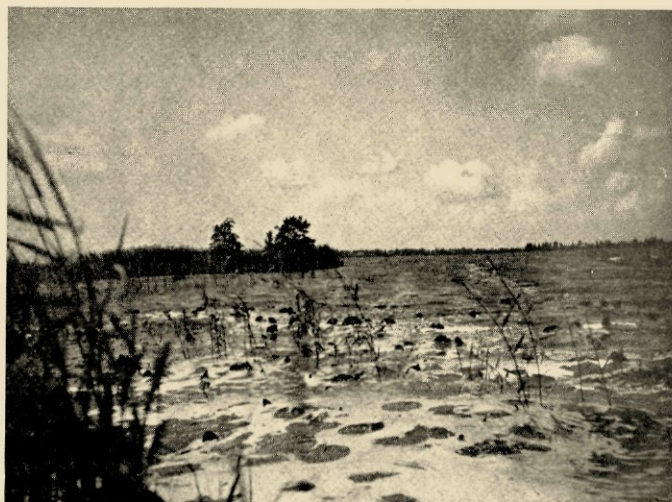
Rechts van het Oortjespad

als om mij te plagen, want hij weet wel, waarover ik praten wil, antwoordt hij: „visschersland” en hij wijst op twee peueraars, die langs een der kleine vaarten komen aandrijven, de strooheid boven het roodgestoofde gezicht en de hand nog aan de hengelroe, die neergelegd wordt naast het bennetje vol zwart-glimmend waternolk. „Noem het dan visschersland”, zeg ik, even geprikkeld,