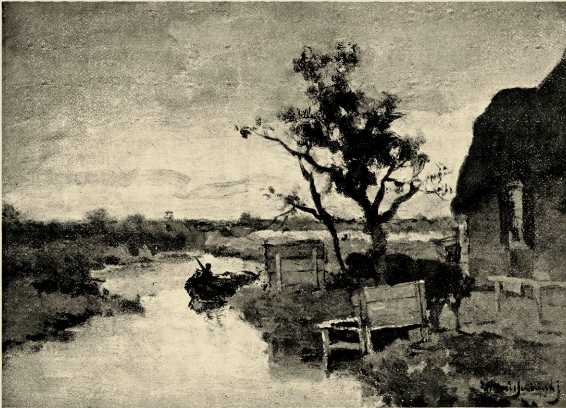
Het van de achterplaats van Het Vliegende Paard te Nieuwkoop door Weissenbruch geschilderde gezicht op de plassen

zijn, die de heerlijkheid dezer weidsche en grootsche tooneelen zóó volkomen vermocht te genieten, dat hij ze herscheppen kon als kunstenaars-antwoord op een roep gekomen uit de sferen der eeuwigheid.