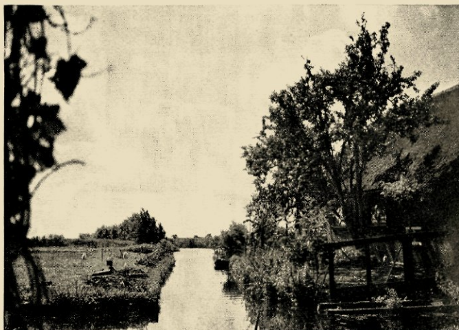
Achterplaats van Het Vliegende Paard (foto 1940), gelijk aan het motief van het tevens afgebeelde schilderij van Weissenbruch

dan eenmaal, wellicht weken lang. Maar dan op een morgen, als hij zijn schildersgerei al bijeen heeft om verweg op zoek te gaan, wordt zijn oog opeens getroffen door iets in de nabijheid: het licht speelt op het huisje, en de blauwe kiel van den boerenknecht, die plaswaarts roeit, vangt er een schamp van, en die blauwe vlek en het gelige groen weerspiegelen in het water, dat ook het wit en blauw van den hemel gevangen heeft. En dat wondere levende