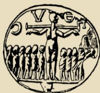
Afb. 3, Gesneden agaath, 3e eeuw. Britsch Museum

Wij mogen hier niet onvermeld laten, dat enkele kunsthistorici en archæologen de hierboven geschetste opvatting bestrijden; zij steunen daarbij op enkele oudheidkundige vondsten, die er inderdaad op schijnen te duiden, dat de wortels van de ikonografie der kruisiging op een vroeger tijdperk dan de 6de eeuw teruggaan. Tot deze monumenten behoort op de eerste plaats het zgn. „Spotcrucifix” uit de 3e eeuw, een krabbel gevonden op den muur van een soldatenwachtkamer in het voormalig keizerlijk paleis te Rome (afb. 2). De teekening stelt voor een mensch met een ezelskop, die aan het kruis hangt