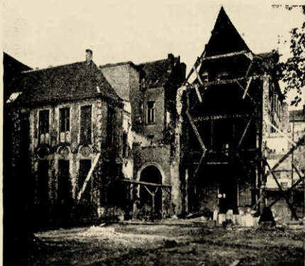
Stalling, doorrij en werkplaats langs de hofzijde gezien