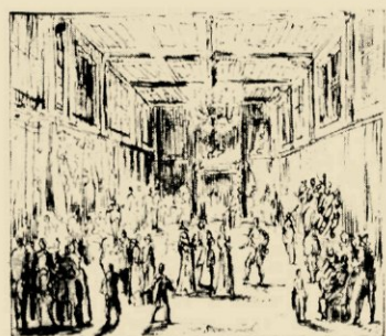
Jacob Swanenburgh, penteekening

Rijksprentenkabinet, Mei, Tentoonstelling van aanwinsten w.o. teekeningen van Jacob Cornelisz. en Jacob Swanenburgh, leermeester van Rembrandt.