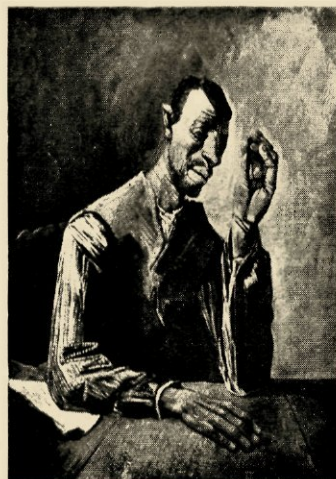
H. Chabot, Boer, 1939

Kunsthandel Aalderink, 20 April—10 Mei, Tentoonstel-