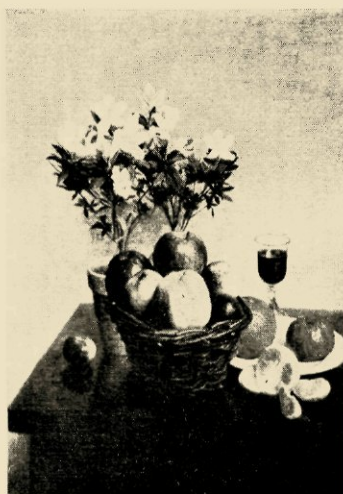
H. Fantin-Latour, Azalea's

27 April—20 Mei, Tentoonstelling van werken van Rotterdamsche kunstenaars (leden van de Ver. Rott. Kunstenaars Societeit en R. 33, benevens van levende in Rotterdam geboren schilders en beeldhouwers).