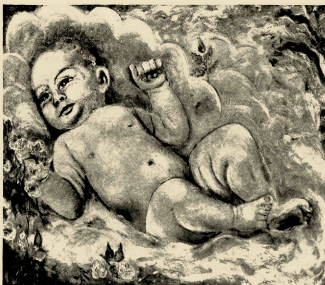
Radda „Le Bébé”

De tentoonstelling „Der Deutsche Westen” is van 20 April tot 20 Mei in het Stedelijk Museum geopend en omvat vijf zalen.