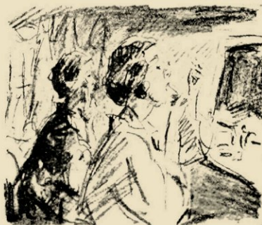
Isaac Israëls, Litho

Rotterdamsche Kunstkring. 13 April—5 Mei, Tentoon-