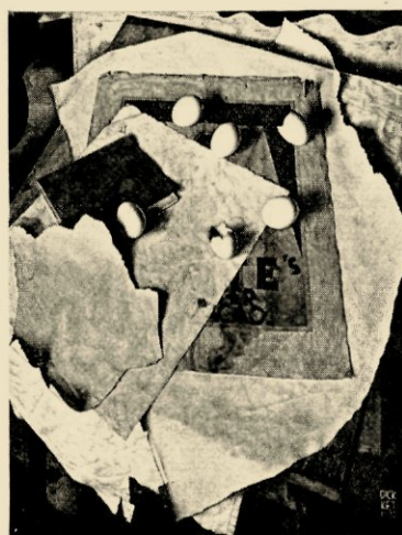
Dick Ket, Stilleven, 1935 Gemeente Museum, den Haag