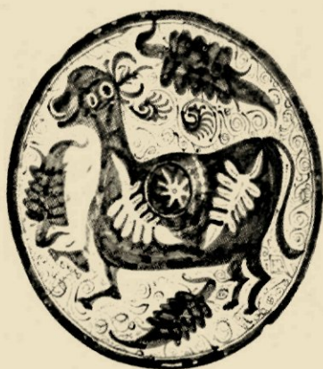
Aardewerk Valencia, ± 1450

huizen Segaar. Maart—April. Het nagelaten grafische werk van Isaac Israëls.