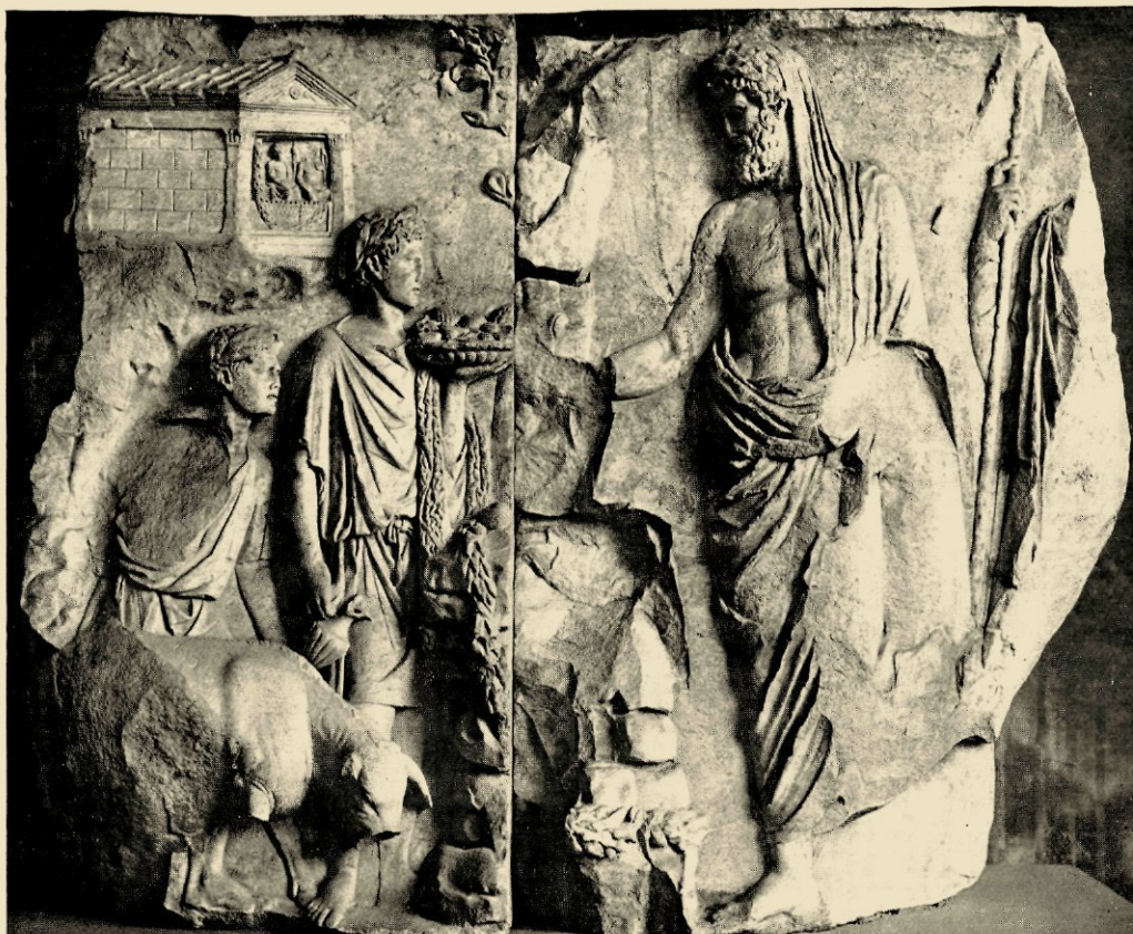
RELIEFS VAN DE ARA PACIS IN HET THERMEN-MUSEUM TE ROME - BOVEN EN LINKSONDER HIERVAN EEN FRAGMENT: AENEAS' OFFER AAN DE PENATEN; RECHTS: DECORATIEF PANEEL MET GUIRLANDE