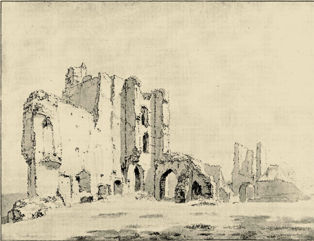
N. BERCHEM: DE RUÏNE TE BREDERO OMSTREEKS 1660, GEWASSCHEN PENTEEKENING (GEM. ARCHIEF, HAARLEM); ONDER: C. PRONK: BREDERODE IN 1747, WATERVERFTEEKENING (MUSEUM BOYMANS)