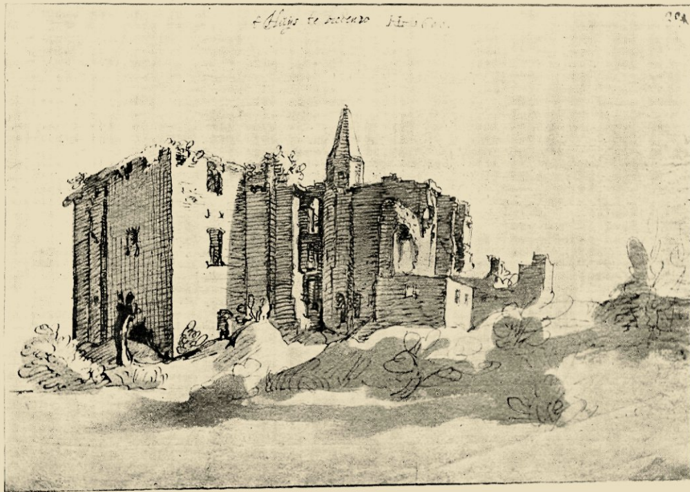
HENDRICK GOLTZIUS: 'T HUYS TE BREDERO, GEWASSCHEN PENTTEKENING 1600 (RIJKSPRENTENKABINET AMSTERDAM); ONDER: JACOB MATHAM, BREDERO IN 1603 (PRENTENKABINET BERLIJN)