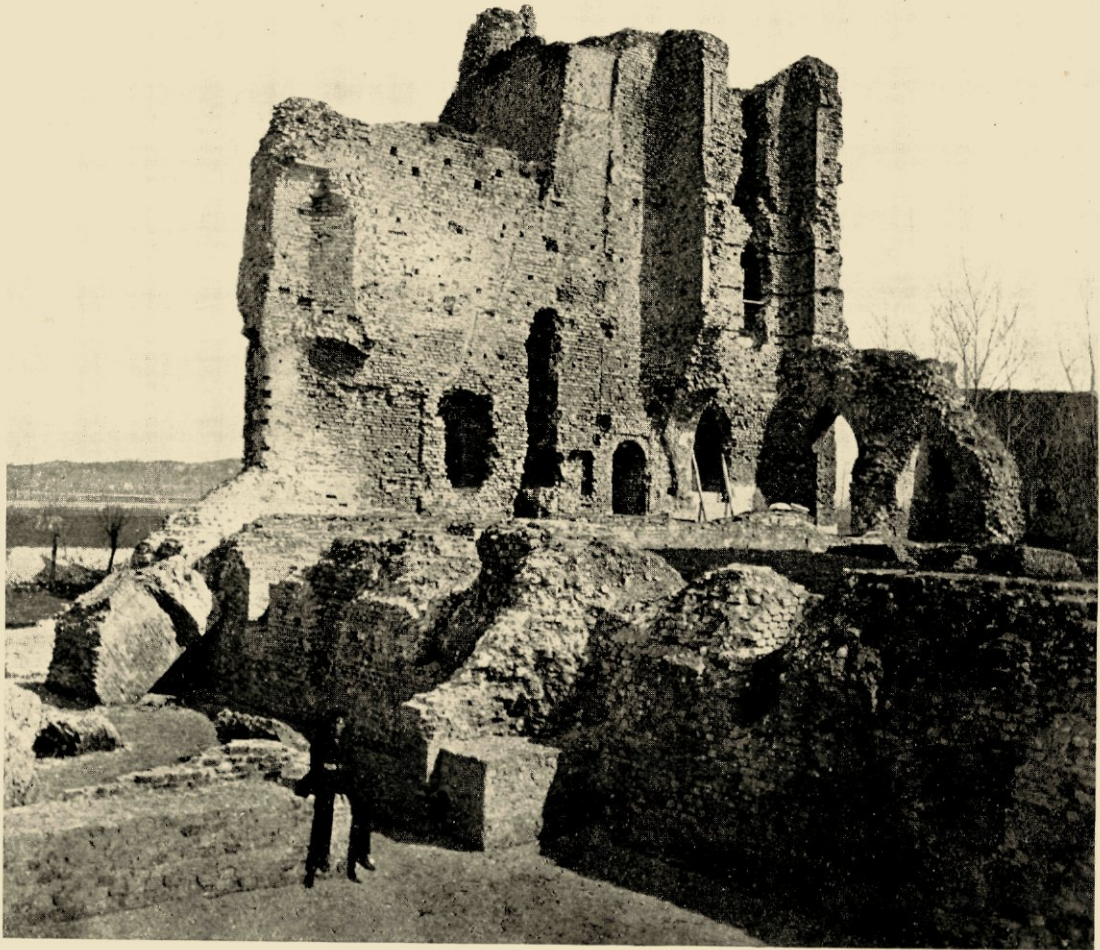
DE RUÏNE BREDERODE OMSTREEKS 1870