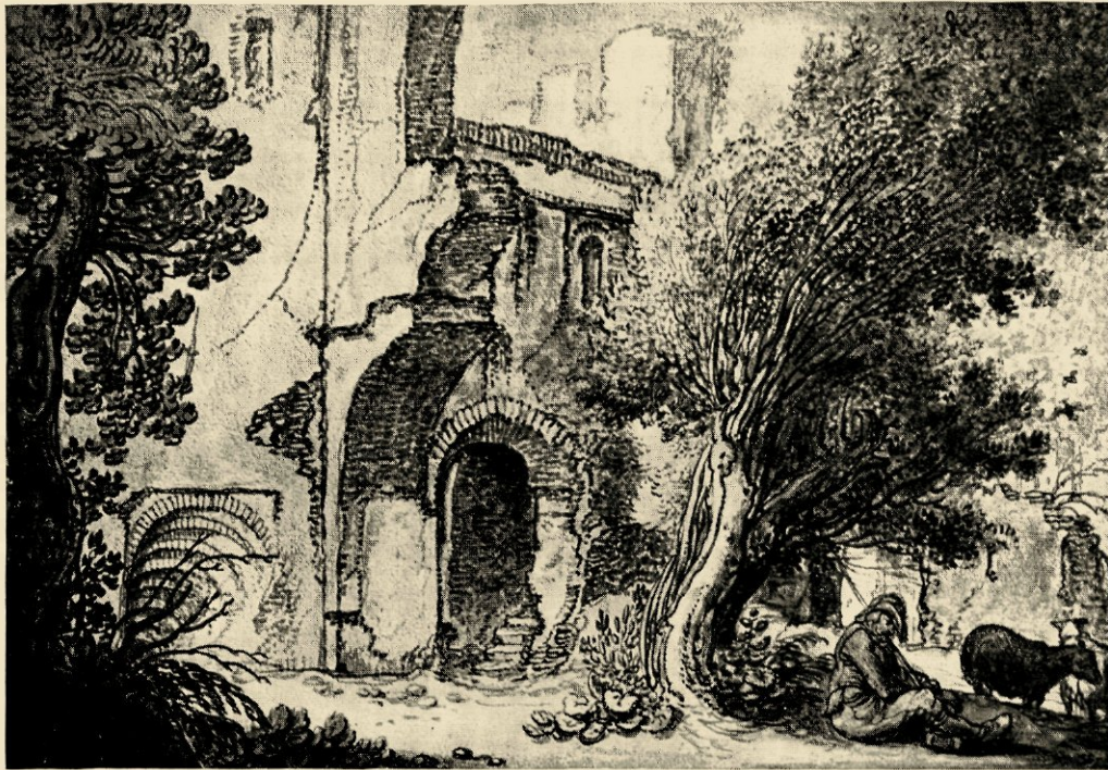
JAN VAN DE VELDE: DE RUÏNE TE BREDERO OMSTREEKS 1635; ONDER: DE TOEGANG — GEWASSCHEN PENTEEKENINGEN (GEMEENTE ARCHIEF, HAARLEM)