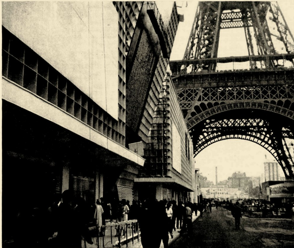
NIEUWE EN OUDE TECHNISCHE VORMGEVINGEN OP DE TENTOONSTELLING: CONTRAST VAN VORM EN SPANNING VAN EIFFELTOREN EN PAVILJOEN DER PUBLICITEIT - BENEDEN: PAVILJOEN DER UNION DES ARTISTES MODERNES