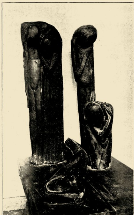
O. ZADKINE. JOB EN ZIJN VRIENDEN, HOUT. 1914.