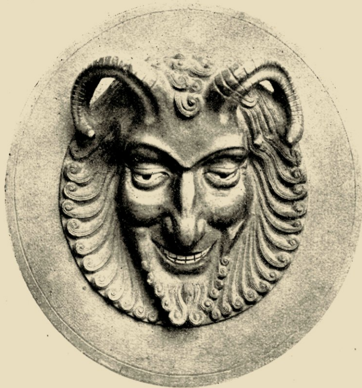
IN BRONS GEGOTEN FAUNENKOP, DOOR DE TANDEN SPUIT WATER. OOGEN EN TANDEN GEËM. 1916. EIGENDOM VAN DEN HEER P. TE R.