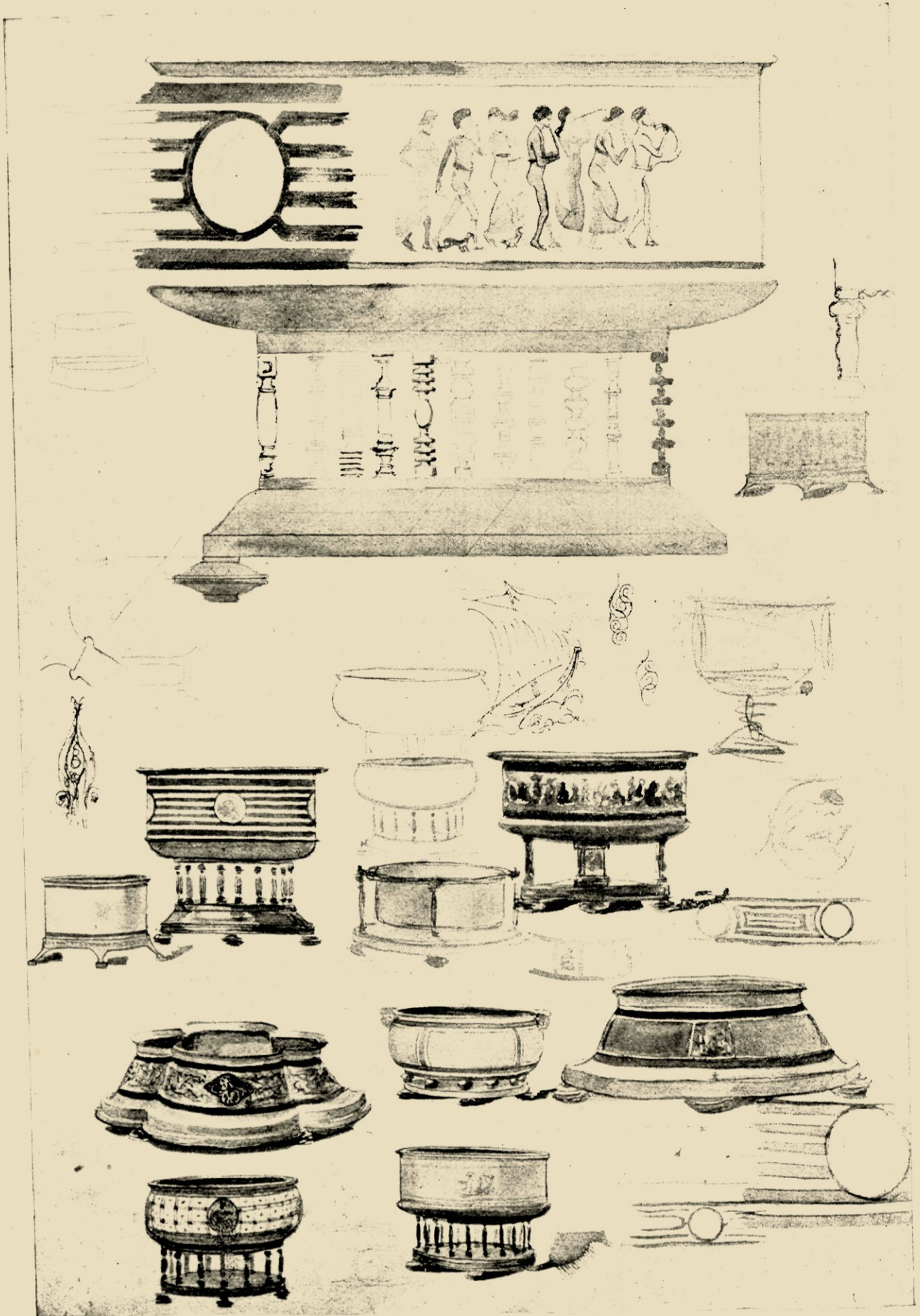
SCHETSBLAD MET ONTWERPEN VAN JARDINIÈRES 1917.