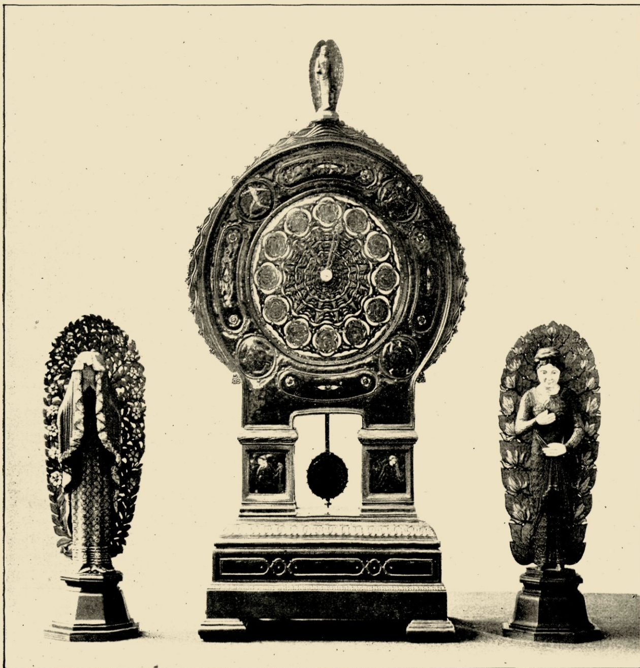
KLOK EN 2 BEELDJES, GEHEEL GEËMAILLEERD. OP DE WIJZERPLAAT 4 VOORSTELLINGEN VAN VOORJAAR, ZOMER, HERFST EN WINTER. OP DEN VOET 2 VOORST. VAN VERLEDEN EN TOEKOMST. ONTWERPEN EN UITGEVOERD IN 1915.

maal samen een inkeer, een zich verwonnen voelen en een overgave aan de schoonheid, die men verstaat.