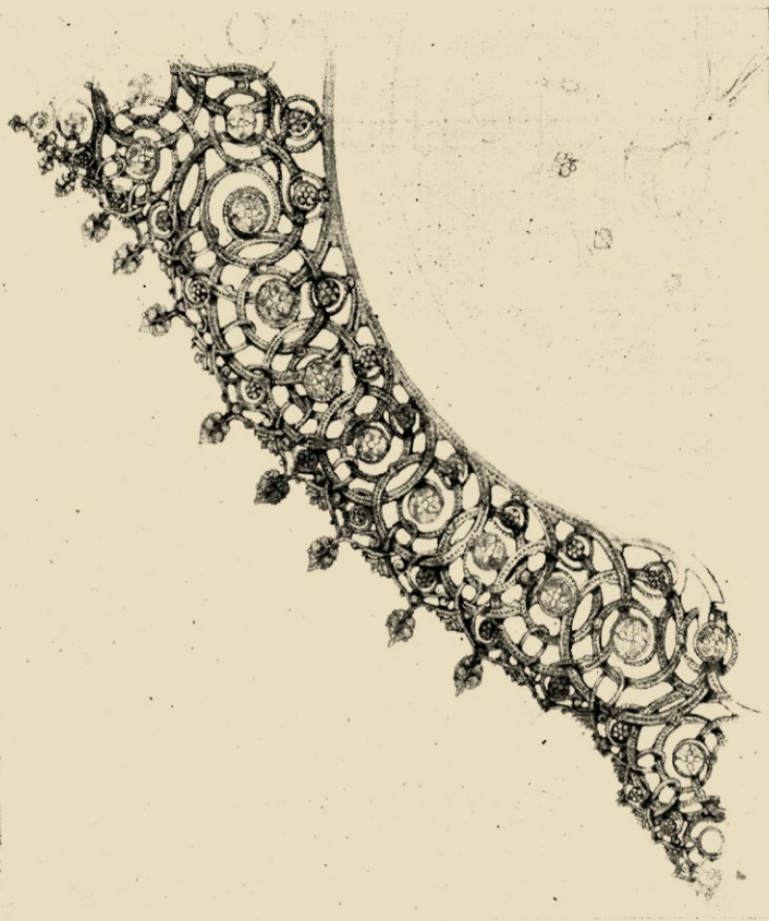
WERKTEKENING VOOR EEN RAND VAN EEN KLOK UITGEVOERD IN 1913.

Van oogenblik tot oogenblik zijn daar de momenten, waarin de kunstenaar, al werkend, schoonheden ziet ontluiken, waarop hij niet verdacht was en die hij niet zocht,