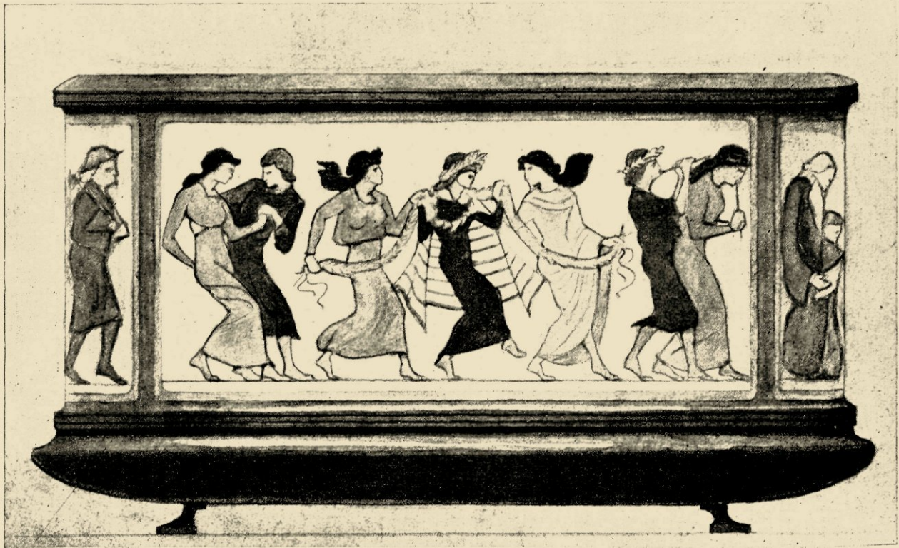
ONTWERP VOOR EEN JARDINIÈRE UIT TE VOEREN IN EMAIL. DE OPTOCHT STELT VOOR: VOORJAAR, ZOMER, HERFST EN WINTER. IN OPDRACHT VAN MEVR. DE C. TE B. 1917.

emaille menschengestalten, gestold, als Aphrodite, uit schuim en gloed.