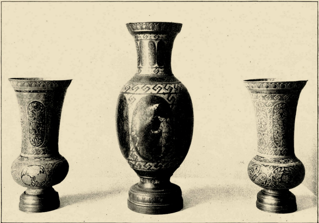
STEL VAN 3 VAZEN. DE VAZEN UIT EEN PLAAT KOPER GESLAGEN, GEHEEL GEËMAILLEERD. ONTWORPEN EN UITGEVOERD IN 1914. DE KLEINE VAZEN EIGENDOM VAN DEN HEER S. TE B.