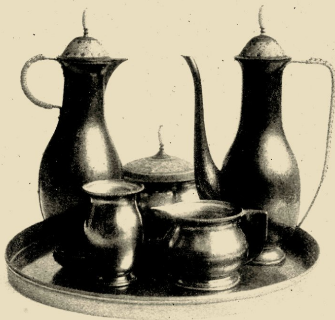
MOKKASERVIES, GESLAGEN IN ZILVER MET GEËMAILLEERDE DEKSELS. ONTWERPEN EN UITGEVOERD IN 1916. EIGENDOM DEN HEER R. TE A.

Waar is, dat zijn wijzerplaten dikwijls meesterwerken zijn van ongezochte overwoogenheid en beheerschten gloed, waar is, dat hij zijn allergelukkigste momenten heeft in zijn: den tijd, de jaargetijden, den dag, de vreugde, den dood symboliseerende