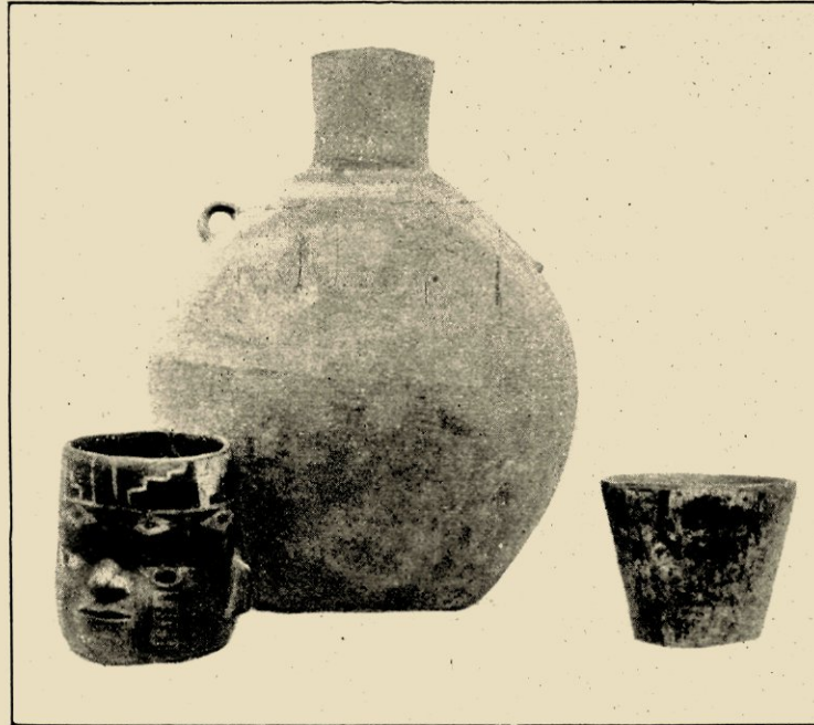
FIG. 3. TIAHUANACO-AARDEWERK; VGL. FIG. 4.

heid van die hun volkomen vreemde cultuur die zij kwamen vernietigen, priesters die, juist tengevolge van hun blinde dweepzucht, niet na konden laten uit te weiden over de afschuwelijke afgoderij, rechtstreeks af-