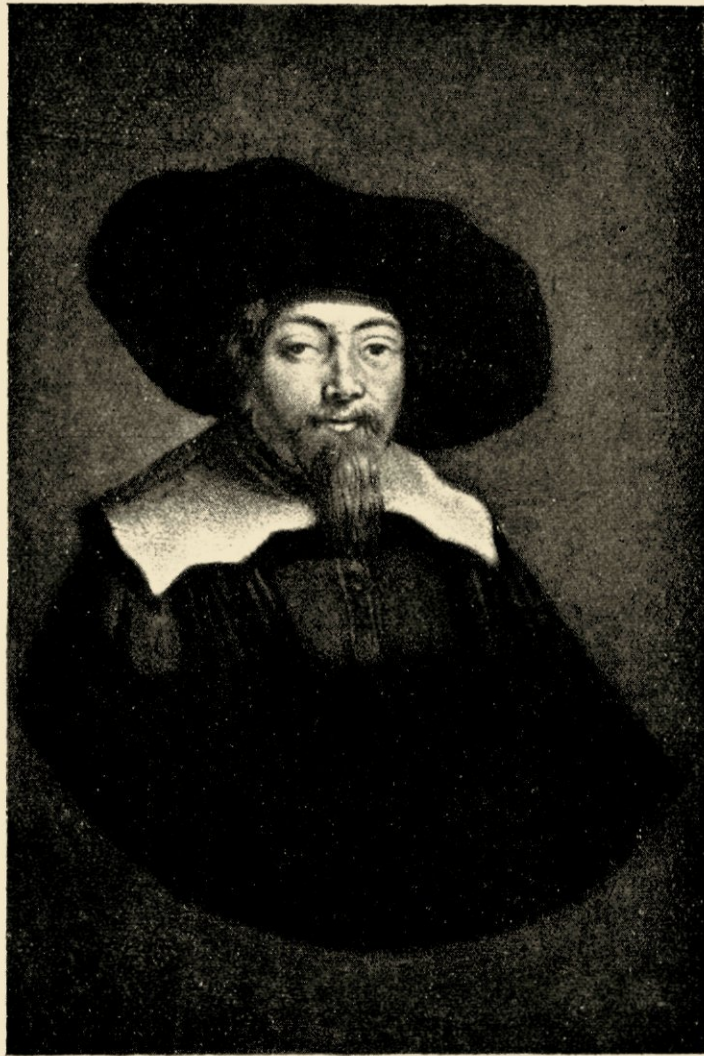
CHACHAM MENASSEH BEN ISRAËL (1604—1657), N. REMBRANDT.

Het spreekt vanzelf dat deze vreemdelingen het gemakkelijkst in de nieuwe wijken woningen kunnen vinden. De Christenbewoners trekken nu langzamerhand uit de nieuwe buurten weg, omdat deze hun met al die Joden niet deftig genoeg meer toeschijnen. Rembrandt en Pieter Codde daarentegen hebben geen bezwaar om naar hartelust te genieten van den pitoresken aanblik dier straten. Zoo ontstaat er vanzelf