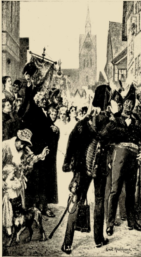
EERSTE JUBEL IN HANNOVERS STRATEN OP 19 MAART 1816