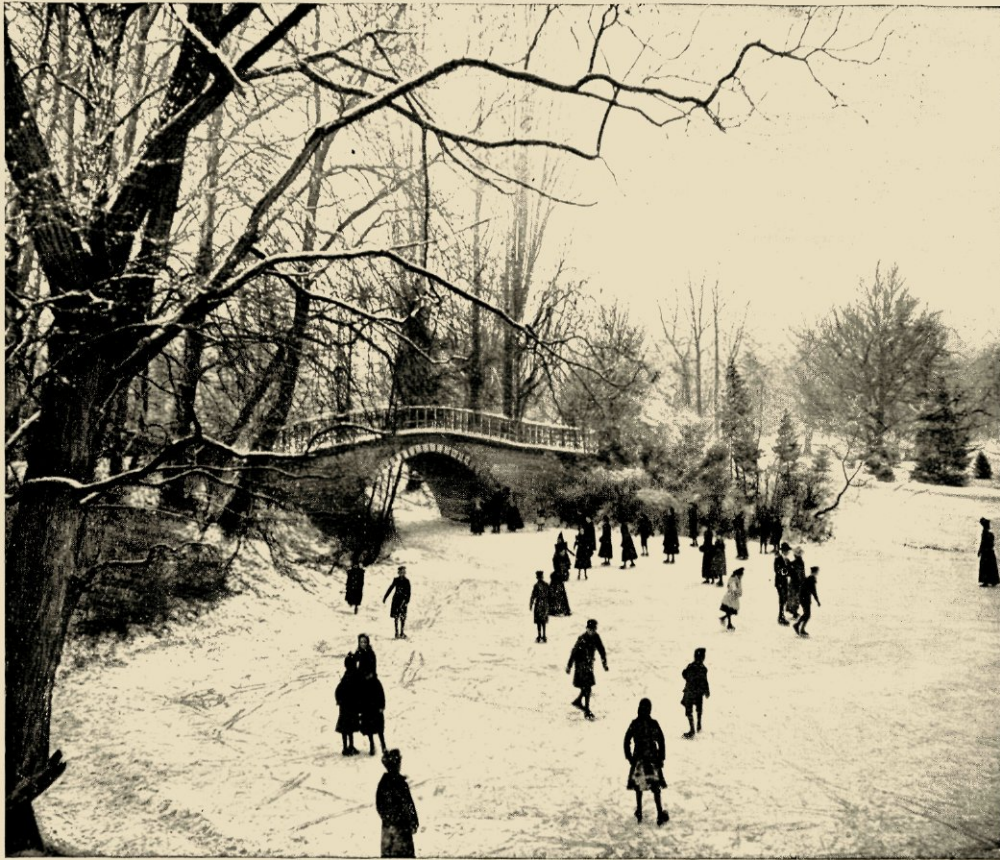
DE BRUGPARTIJ IN DEN GEORGGARTEN BIJ WINTER.

van Delille en Gessner ook de richting aan op het continent, waar onder Rousseau's motto „terug naar de natuur” Bernardin de Saint Pierre volgde met verhalen als „Paul et Virgine”, en „De Indische Hut”, terwijl de abt Jacques Delille in zijn: „Les Jardins” zijn ideaal van tuinenschoonheid weergeeft in: