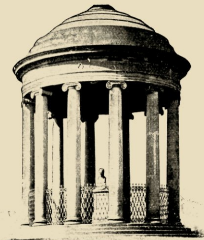
DE TEMPEL TER EERE VAN LEIBNIZ OPGERICHT TER ZIJDE VAN DE WATERLOOPLATZ TE HANNOVER.