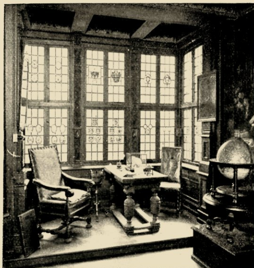
HET STERFVERTREK VAN LEIBNIZ IN HET GERESTAUREERDE LEIBNIZHAUS TE HANNOVER.

In 1854 begon de vermaarde Tramm de plannen te ontwerpen voor een nieuw vorstelijk verblijf in de residentie, welke plannen van 1857—1866 in uitvoering werden genomen. Maar de catastrofe van het Hannoveraansche rampjaar maakte ook hieraan een onverwacht einde en we zien het gebeuren, dat negen jaren lang de bouw totaal stil ligt. Wel stonden de façades en was het buitenwerk grootendeels af, doch het inwendige was nog een holle zalen- en kamer-