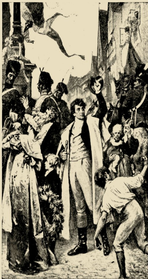
TERUGKEER VAN HET OVERWINNENDE HANNOVERAANSCHÉ LEGER.

snoeide Taxus en Buxusboompjes door den spottersbriil waarmede Pope op een auctie een catalogus samenstelde, die o.m. de volgende aanprijzingen bevatte: „De toren van Babel, nog niet geheel voltooid; een koningin Elisabeth, van Filaria, wel een beetje bleek. Adam en Eva in Taxus, Eva heeft een weinig geleden door den val van den boom des goeds en des kwaads”.