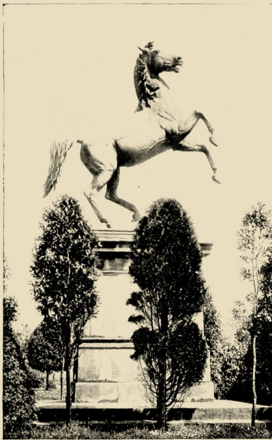
HET SAKSENROS, HET SYMBOOL VAN HET WELFENHUIS TE HERRENHAUSEN.

die een ernstigen toegangsweg vormt voor het in Grieksch-stijl opgetrokken mausoleum van koning Ernst August en Koningin Friederike, een tempel, die door zijn strengen eenvoud van lijnen niet nalaat op ieder devoot bezoeker een verheven indruk te maken. Het inwendige van deze naar Laves plannen gebouwde doodenhal is geheel van Carrarisch marmer en vormt een wijdingsvullen dom over de twee, door Rauchs meesterhand gebeeldhouwde sarcophagen. Het geheel is zonder overdadige versiering