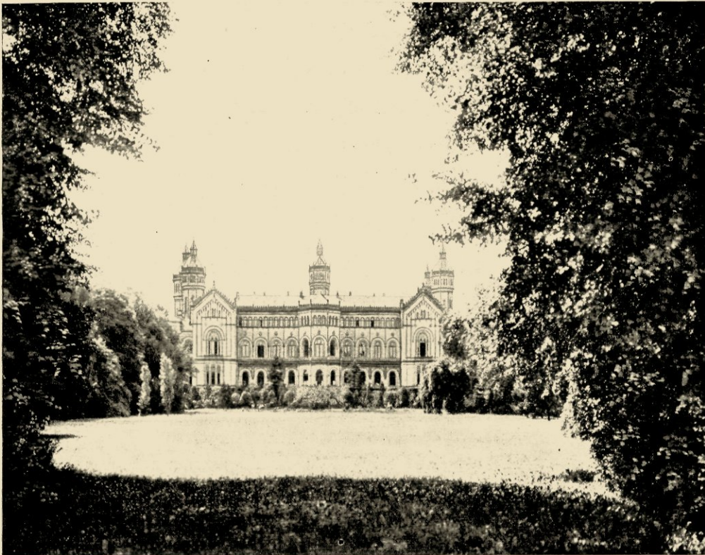
HET WELFENSLOT GEZIEN VAN DE TUINZIJDE.

Even verder staat ge voor de imponerende glas- en ijzerconstructie van het groote palmenhuis, dat reeds in het revolutiejaar 1848 gebouwd werd, doch in de jaren 1879—1880 werd ingericht. De roem van