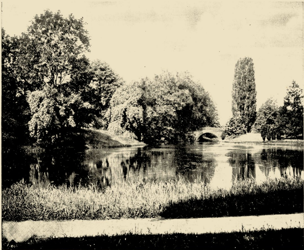
DE ENGELSCH LANDSCHAPSTIJL IN DEN GEORGGARTEN TE HERRENHAUSEN.

Geen hofheer vond het meer met zijn waardigheid passen in eigen persoon de boompjes te knippen al was dat ook jaren lang in zwang geweest zoodat de betrouwbare Dangean ons zelfs als een zijner meest voorkomende memorandes in zijn werk over Versailles mededeelt: „Tel jour le roi taillit ses Ifs”.