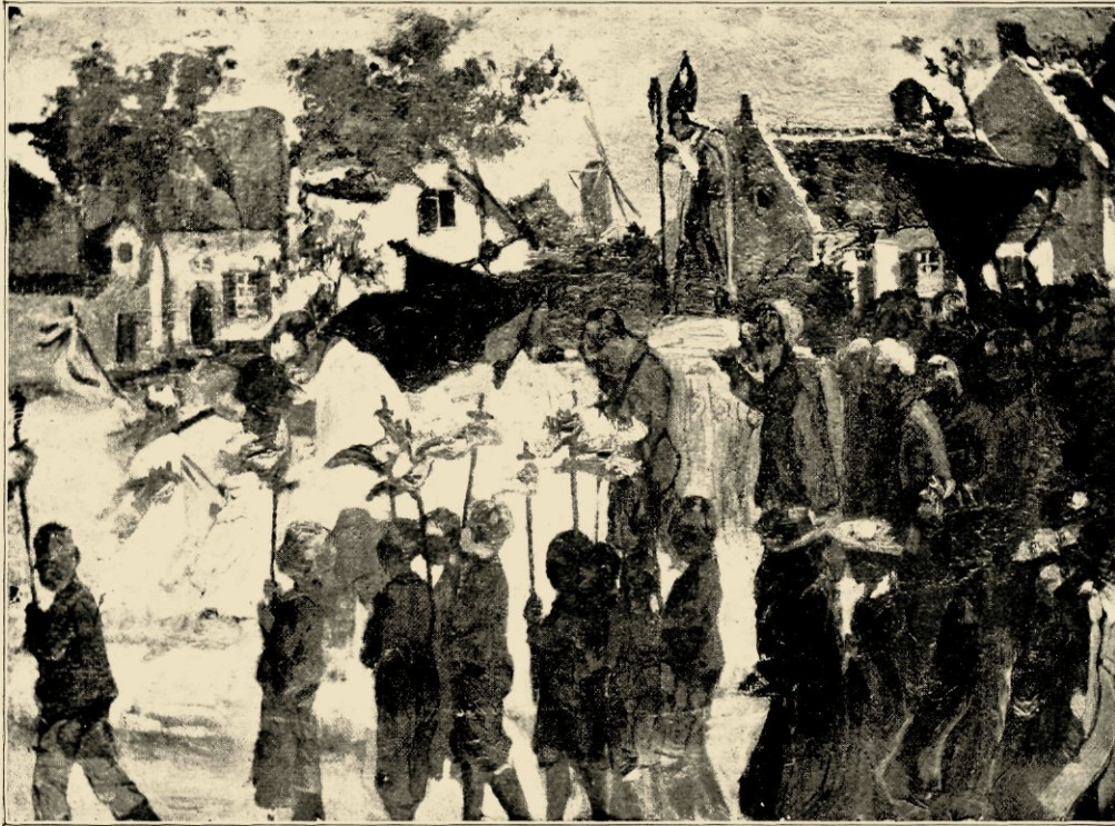
PROCESSIE (VERZAMELING FERDINAND BUYL, BRUSSEL).

hem toe ook al eens de beenen onder tafel te steken.