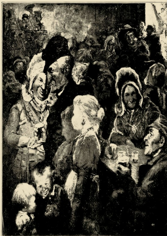
KERMISTAFEREEL (VERZ. DE DEKEN, BRUSSEL).

Met den dag komt hij nader tot de lieden uit de streek.