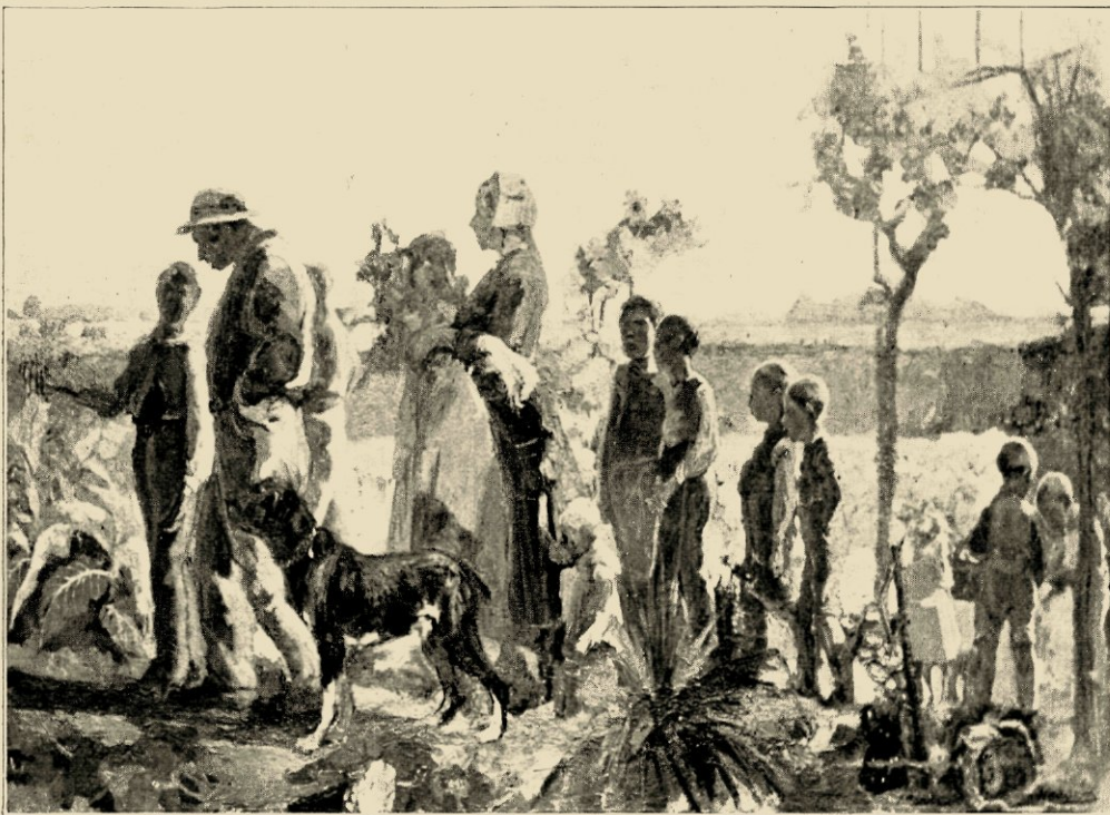
HET GEZIN VAN DEN LANDMAN.

Dat kon echter wel de hooggeleerde, fijn-