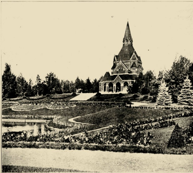
DE OMGEVING VAN DE ROMAANSCHIE KAPEL (STETTIN).

De gemeente architect W. C. Muller heeft met groote piëteit het aan de begraafplaats liggende boschpark van een voormalige buitenplaats, waarvan het heerenhuis als ontvanggebouw dienst doet, ongeschonden gelaten. Een schilderachtige vijver ligt er stemmingsvol als een „Totenmeer” tusschen eerwaardig geboomte. Alle factoren werken hier mede om een het ideaal nabije be-