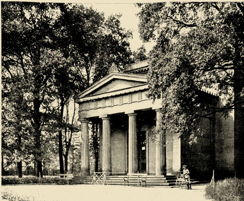
HET KONINKLIJK MAUSOLEUM VAN HERRNHAUSEN.

critische beschouwing levendig herinnerd aan de woorden van Stettins kerkhofdirecteur Hannig, toen hij ironisch in een lezing te Liegnitz vertelde: