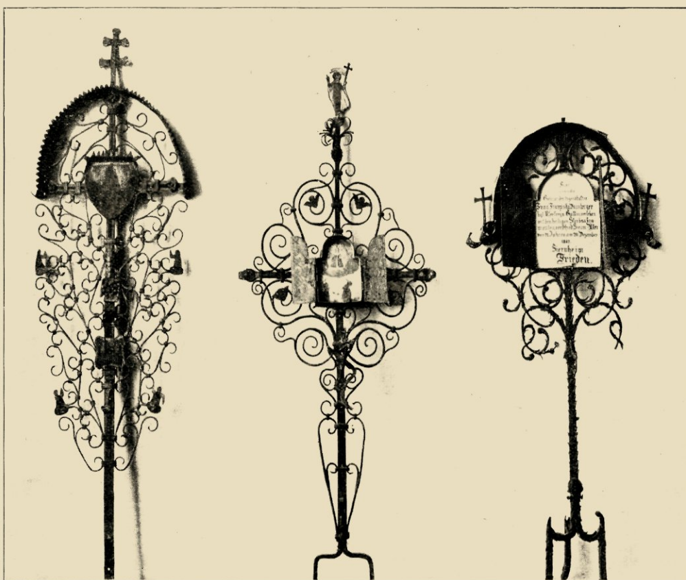
RIJK VERSIERDE ZWEEDSCHE GRAFKRUIZEN.

Dat is natuurlijk in lijnrechte tegenstelling