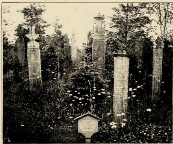
HOUTEN GRAFTEEKENS UIT POMMEREN IN DE HISTORISCHE AFDEELING VAN HET KERKHOF TE STETTIN.

Zoo toont Skansen de oude grafkruisen uit het kerspel Rackeby in de provincie Westergotland, welke niet noemenswaard afwijken van de middeleeuwsche vormen, zoo stond ik stil bij menigen Rünestein uit de eerste eeuwen van het Christendom, ontcijferend het nog aanwezige rünenschrift inhoudend een vrome bede voor het zieleheil van den afgestorvene, terwijl vele grafteekens in ijzer zeldzame piëteit verraden in de kunstzinnige bewerking van het smeedwerk. Welke merkwaardige theorieën zouden de folkloristen hier kunnen toetsen aan vergelijkingsmateriaal. Hoe zou kunnen worden uitgemakt of het kruis met den cirkel het