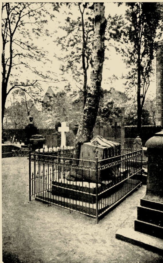
HET „GEOPENDE GRAF” OP HET GARTENFRIEDHOF TE HANNOVER.

Afgezien van deze bloembedden, heeft men de meer dan een kilometer lange 40—150 M.