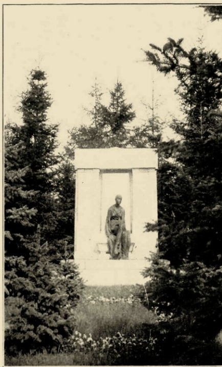
EEN MET DE ZORGVULDIGE BEPLANTE OMGEVING HARMONIEEREND GRAFMONUMENT UIT SCHELPEKALK MET BRONZEN FIGUUR IN HET STETTINER FRIEDHOEF.

waaronder die van Hadrianus en Augustus kamers van Mycene rustten de dooden, met