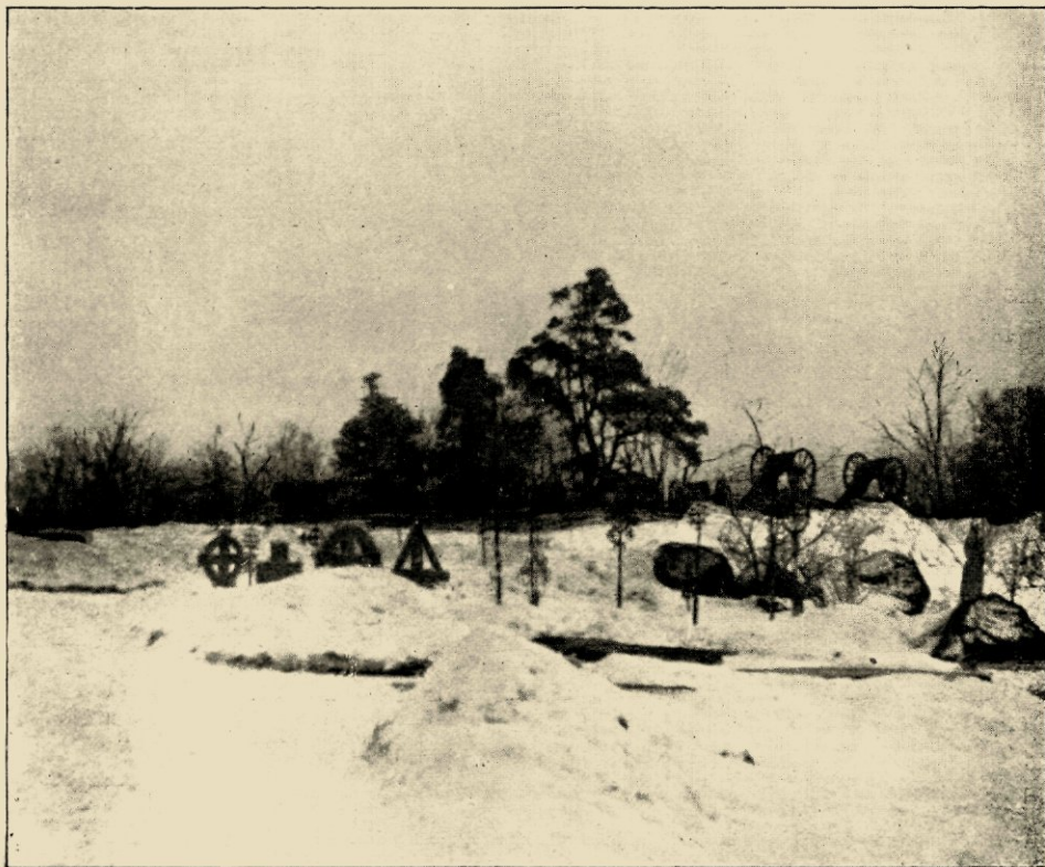
HET IMITATIE-KERKHOF IN SKANSEN BIJ STOCKHOLM.

Een zeer merkwaardige milstolpe van 1737 uit Smaland is een meer dan anderhalve eeuw oude getuige voor de duurzaamheid van goed eikenhout zelfs in een zoo ruw klimaat als Zweden voor een groot deel van het jaar aanwijst. Uit een kul-