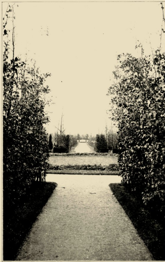
DE ERNSTIG-SOBERE BEPLANTING DER LEICHENSTEG OP HET KERKHOF TE STETTIN.

gele korreltjes meevoert, de lucht bezwangert met millioenen levenskiemen, niet ieder geniet er van de bloedroode katjespracht der lorken te midden van het sappig weke lentegroen, want de mysterieuse schoonheid, die in zulk een doodenoord gevonden wordt in het contrast van teer eendagsleven en stoer oud eeuwigdurend naaldengroen is slechts voor de ingewijden in het natuurleven.