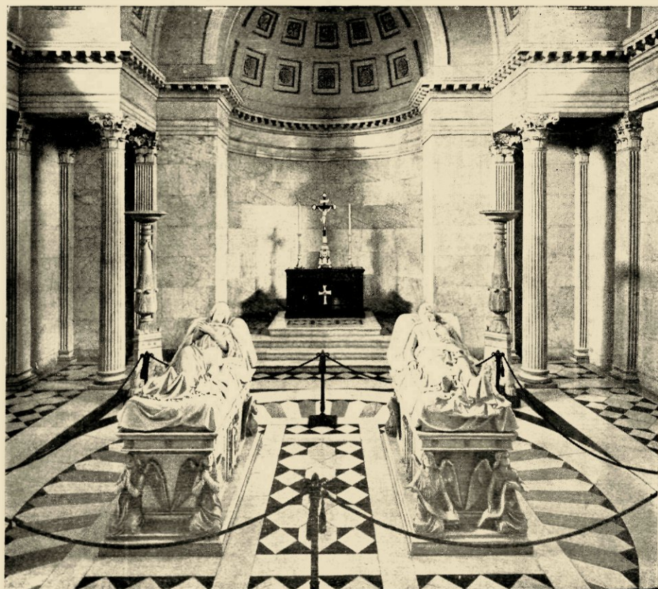
HET INWENDIGE VAN HET MAUSOLEUM VAN KONING ERNST AUGUST EN KONINGIN SOPHIE.

Vele stemmen verhieven zich echter tegen een dergelijke vroolijke kerkhofopvatting,