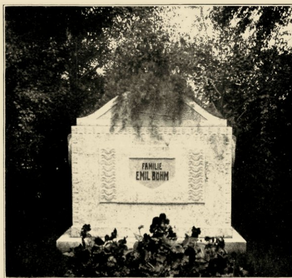
MODERN FAMILIEGRAF VAN MUSCHELKALK TE STETTIN.

Wij geven (bl. 433/4) het koninklijk mausoleum van Herrnhausen, waar temidden van een trotsche omgeving een statige oude lindenlaan den toegangsweg vormt naar het in Griekschē stijl opgetrokken laatste verblijf van de als een vader des vaderlands beminden koning Ernst August en Koningin Friederike van Hannover. Het inwendige is door de weloverwogen architectuur en door het rijke Carrarisch marmer van een wijdingsvolle schoonheid. De op marmeren sarcophagen rustende beelden zijn volgens deskundigen de groot-