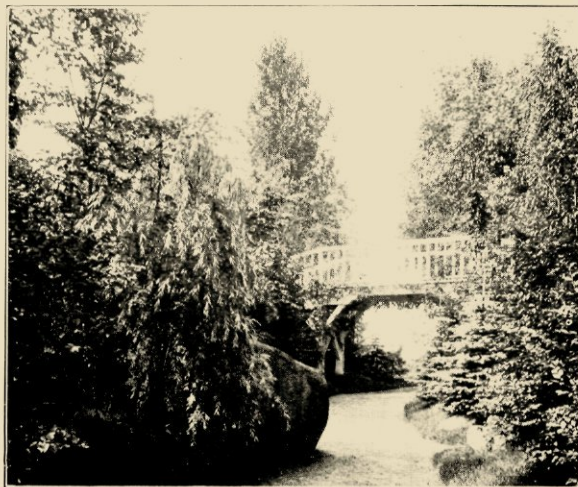
DE RUSTIEKE BRUG IN DE URNENAFDEELING VAN HET STETTINER FRIEDHOF.

Evenals een treurend ontmoedigd, neerslachtig man, in zijn vorevergebogen houding, zijn kromme knieën en de zwaar langs het lichaam neerhangende armen in de vallende lijn de droefheid zijner ziel uitdrukt, zoo vindt men deze terug in de buigende takken van den treurwilg, die wijzend naar de aarde van waar ge gekomen zijt, schijnen