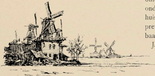
..... GELEKEN OOK OP ARMLASTIGE KINDEREN IN EEN TAFELSTOEL.”

Niet die maar twee meter hoge molentjes,