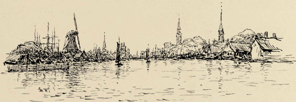
ZAANDAM, HEEL LAAG LIGGEND AAN HET WATER.

Bijna alle van hout, die huisjes, bijna alle licht groen geverfd en zoo zindelijk, zoo knusjes, met een bloemperkje hier, met wit gekalkte boomstammetjes daar, met een blauw brugje en een wit hekje, en met smalle paadjes en slootjes er tusschen, waarlangs ik