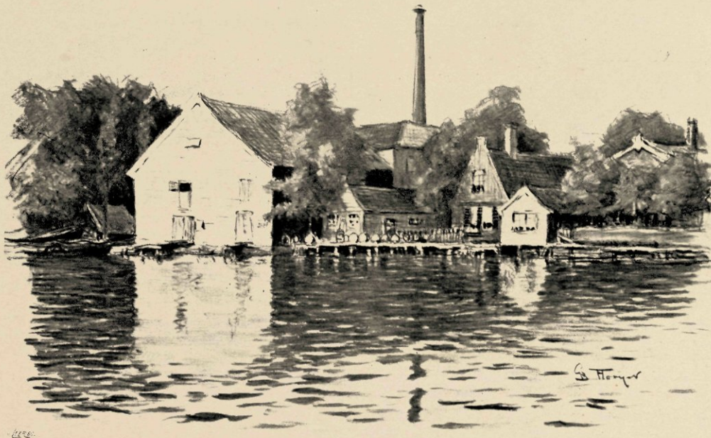
„HET STAAT MET EEN PREUTSCH GEZICHTJE VOOR HAAR SPIEGEL VAN WATER.”

De breede Zaansche waterweg met zijn kleine woningen, gezonde boomgroepen en rijen van molens, slingerde daar voor mij uit. Een der vele slagaderen van het land mijner vaderen. Al loopt dat water traag en opgehouden