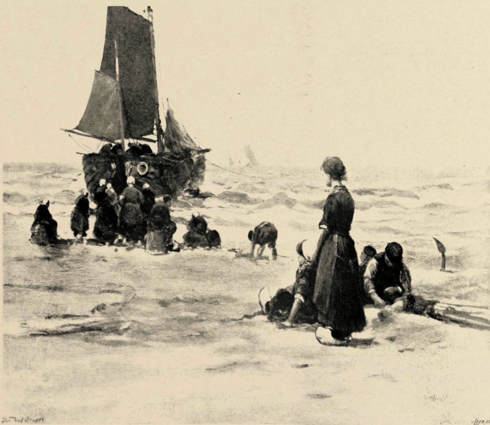
VERTREK VAN DE VISSCHERSVLOOT