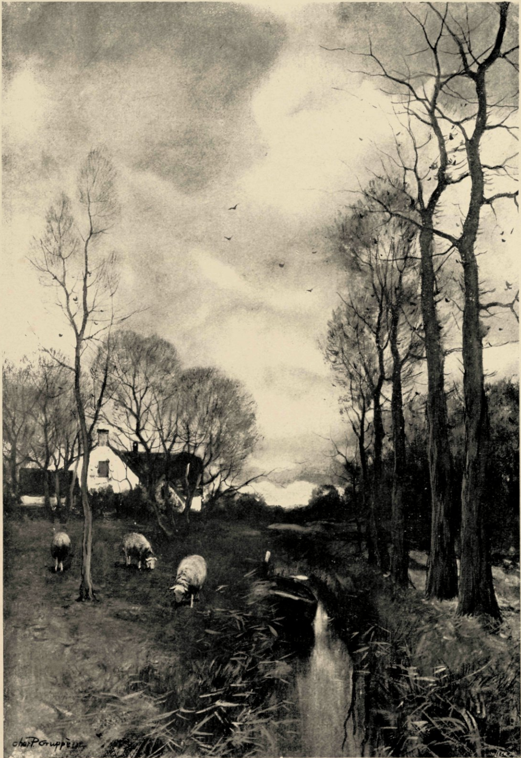
DE OUDE BOERDERIJ AQUAREL

IN DE COLLECTIE VAN WOLF TE PHILADELPHIA