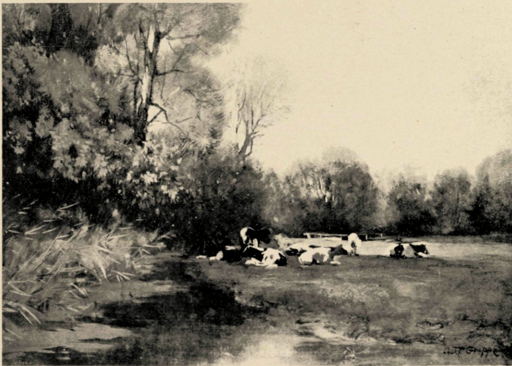
EEN RUSTIG HOEKJE WEILAND