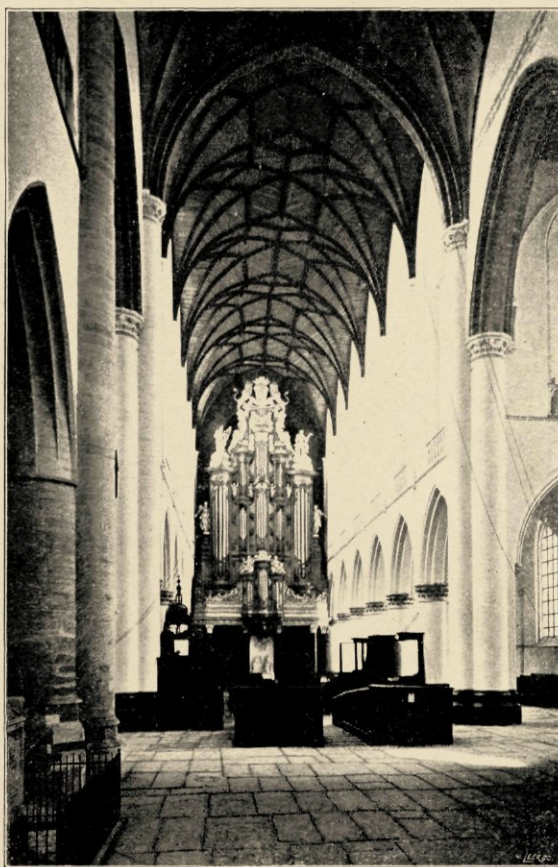
HET SCHIP DER ST. BAVOKERK VÓÓR DE RESTAURATIE.