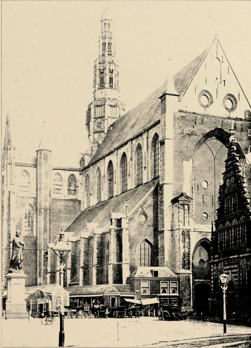
DE ST. BAVOKERK VAN HET NOORDWESTEN, VÓÓR DE RESTAURATIE

begonnen. Voor een kolossalen toren ter plaatse, waar later de Vleeschhal zou verrijzen, werden klokken besteld, die voorloopig in een houten klokhuis achter de kerk, waaraan het Klokhuisplein de herinnering bewaart, werden opgehangen.