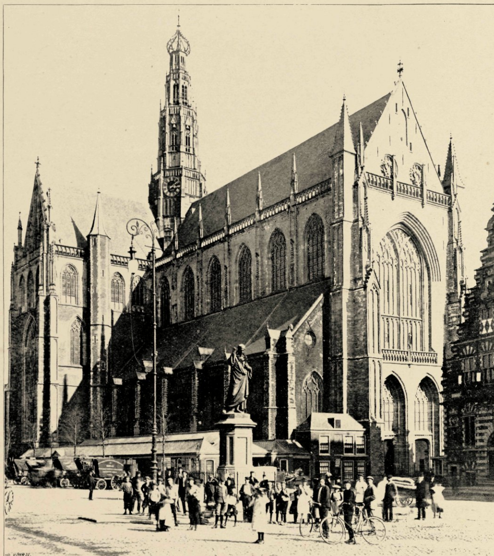
DE ST. BAVOKERK VAN HET NOORDWESTEN, NA DE RESTAURATIE.

De opstand van het Kaas- en Broods-volk maakte echter aan Haarlem's welvaart een einde. Met moeite werd in 1496 de verhooging der kruisbeuken voleindigd. Met den toren is nooit begonnen; de westelijke gevel, die in zijn onvoltooiden staat de heugenis aan den beraamden torenbouw bewaarde, is, sinds hij in onzen tijd met velerlei lofwerk werd opgesmukt, geheel van aanzien veranderd.