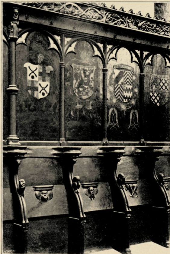
DE KOORBANKEN IN DE ST. BAVOKERK.

Talrijke altaren waren, voor de Hervorming, in de kerk geplaatst. Van het altaar, aan de HH. Petrus en Paulus gewijd zegt Van Mander,