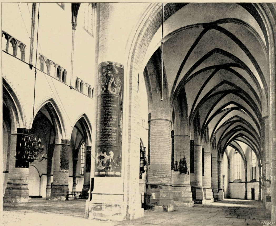
DE ZUIDELIJKE ZIJBEUK VAN HET KOOR DER ST. BAVOKERK, NA DE RESTAURATIE.