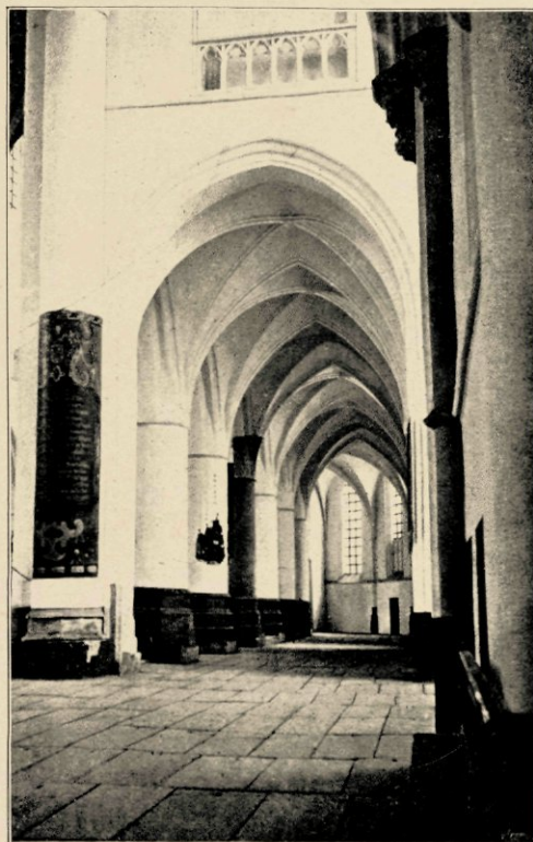
DE ZUIDELIJKE ZIJBEUK VAN HET KOOR DER ST. BAVOKERK. VÓÓR DE RESTAURATIE.