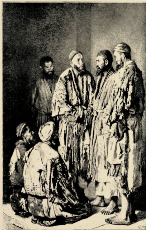
POLITICI IN EEN OPIUMHUIS (Museum Tretjakof, Moskou).

van kunst beschouwd worden. Zet, om maar eens iemand te noemen, hem eens naast Israëls, wat blijft er dan van hem over? Een verver, een brutale er-op-los-smeerder, zonder eenig benul van kunst. Maar Werasjtsjagin is geen belijder van het beginsel: l'art pour l'art. Zijn uitdrukkingmiddel, het schilderen valt nu eenmaal onder het begrip kunst, en zoo zou men kunnen zeggen is de publicist, de novellist Werasjtsjagin toevallig kunstenaar. Hij is in de eerste plaats publicist, hij wil vertellen van vreemde landen, die hij gezien heeft, van oorlogen en veldtochten, die hij heeft meegemaakt. Het beste uitdrukkingmiddel daarvoor vindt hij zijn penseel, waarmee hij ook handig weet om te gaan, om objectief het geziene en meedoorleefde weer te geven. Hij heeft goed ingezien, dat hij met zijn penseel levendiger en onderhoudender tot het groote publiek kon spreken dan door schrijven. En hij heeft het verstaan door geschikte reclame het publiek te roepen naar zijn tentoonstellingen. Zijn schilderijen spraken ook veel beter dan litteratuur over dergelijke onderwerpen, zooals een kinematoscoop ons