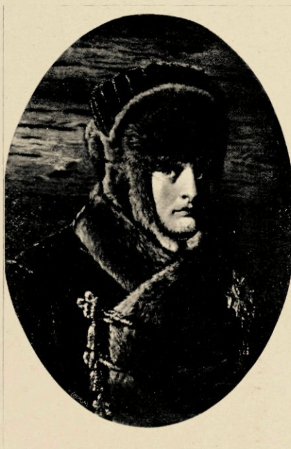
STUDIE VOOR DE NAPOLEON-FIGUUR (Museum Alexander III, St. Petersburg).

Werasjtsjagin achtte den tijd van rusten voor zich echter nog niet gekomen, en bij gebrek aan een actueel onderwerp voor zijn oorlogsschildering, deed hij een greep in de geschiedenis, en koos den grootsten modernen veldheer der wereld, Napoleon, als hoofdfiguur voor een nieuwe serie van schilderijen, waarmee hij zijn roem nog belangrijk grooter dacht te maken. Maar Werasjtsjagin bleek als historie-schilder dezelfde man niet als wanneer hij dingen schildert die hij zelf gezien en meegemaakt heeft. Zijn Napoleon schilderijen hebben zijn naam geschaad. De