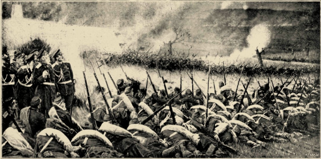
VÓÓR DE ATTAQUE (Museum Tretjakof, Moskou).

door menschen van gezag verklaard, dat Werasjtsjagin alleen de maker was van zijn schilderijen-cyclus. Maar zijn vijanden lieten niet van hem af, en het publiek werd meegesleept. Men verweet hem, dat hij het leger, den militairenstand in discredit bracht met zijn schilderijen, die overdreven realistisch waren, die al het ridderlijke, de poëzie van den oorlog schenen te willen doen vergeten, er op gemaakt schenen, om alleen het bloederige, het leelijke, 't afgrijselijke van den oorlog af te beelden. Werasjtsjagin zag goed in, dat dit verwijt juist de sterkste zijde van zijn talent trof, en hij ontwikkelde daaruit zijn tendens. Overigens ontstemd door het fiasco bij zijn landgenooten, trok hij nu met zijn werk naar 't buitenland, waar hij deels door geschikte reclame, maar ook door het sensationele karakter van zijn kunst, al gauw de held van den dag werd. Zijn werk uit dien tijd behoort qua schilderwerk, ook wel tot het beste wat hij gemaakt heeft. In zijn werk van den Turksch-Russischen oorlog naderhand is hij al heelemaal de tendensman geworden, die hij wilde zijn. Zijn Toerkestan-schilderijen zijn met veel zorg en liefde gedaan, zijn kleur is wat bont, maar er is licht en warmte in zijn oostersche hemels, hij teekent de architectonische details van de interessante bouwvallen uit den tijd van den grooten Tamerlan levendig en met veel smaak, zoodat ze een