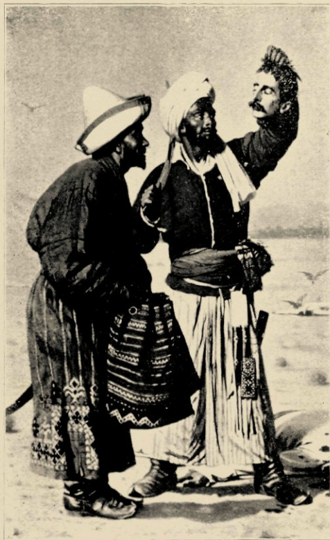
DE OVERWINNAARS (Museum Alexander III, St. Petersburg).

die steeds slaaf is van zijn geweldige routine, Sjisjkin, de boschschilder. Repin, de grootste der levende Russische meesters, hoewel de modernen hem als zoodanig al niet meer erkennen, heeft een fraaie techniek, maar zijn werk gaat niet diep. Dan komt Soerikof, wel de merkwaardigste, een man uit één stuk, een autodidact, wiens innig kunstenaarsgevoel met een groot kunnen gepaard gaat. Veel schilderijen kent men van hem niet, maar zijn groote doek in het museum Alexander III te St. Petersburg, de verovering van Siberië door den vrijbouter Jermak, is een prachtstuk, een klinkend heldendicht. Wasnetsof hierboven al genoemd is een der eerste voor mannen der nieuwere frissche richting in de Russische kunst.