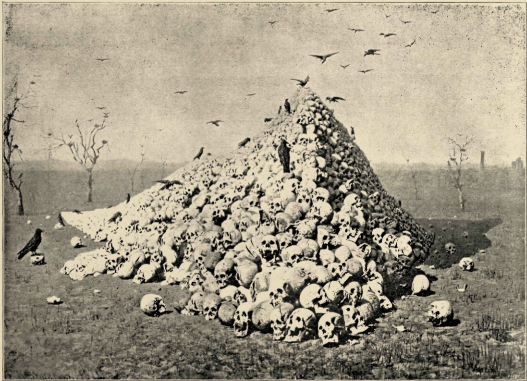
AAN ALLE GROOTE OVERWINNAARS UIT HET VERLEDEN, HET HEDEN EN DE TOEKOMST ( Museum Tretjakof, Moskou ).

Naar Oostersche zeden heeft de overwinnaar zijn zege gevierd en de hoofden der verslagen vijanden bijeen laten stapelen op een machtigen hoop. Aasvogels hebben er het vleesch afgescheurd, de zon boven de eenzame zandvlakte heeft de schedels gebleekt.