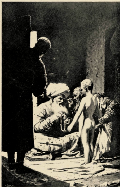
1 E. SLAVENKOOPMAN (Museum Tretjakof, Moskou).

menten die hij hier en daar te hooren kreeg. Zoo zou keizer Wilhelm II eens tot hem gezegd hebben, dat zijn schilderijen het beste middel ter bevrijding van den oorlog waren, en mensen als Meissonnier en Menzel zouden onverholo hun bewondering voor hem hebben uitgedrukt. Ten minste Werasjtsjagin vertelt daarvan in zijn memoires. Zelfs zou Meissonnier zich door Werasjtsjagin hebben laten vertellen hoe je goed sneeuw moet schilderen. Meissonnier boetseerde nl. een modelletje van een door kanonnen uitgereden weg, strooide er meel en zout over en schilderde daar-naar dan.