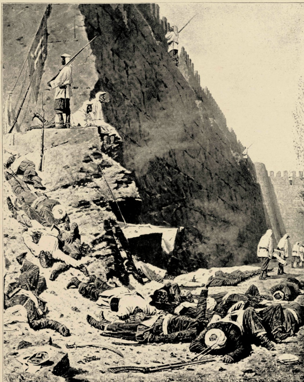
NA DE BESTORMING VAN SAMARKAND (Museum Tretyjakof, Moskou.)

op die opvatting van het publiek, dat hem al gauw op het voetstuk van een vredesapostel hief, ging hij van nu af aan steeds meer en meer in tendentieuze richting voort. De sterkst uitgesproken tendens ligt wel in het bekende groote schilderij met de opdracht er onder: „Aan alle groote overwinnaars van het verleden, van het heden en van de toekomst”, de pyramide van door kogels doorboorde en door sabels gespleten doods-koppen.