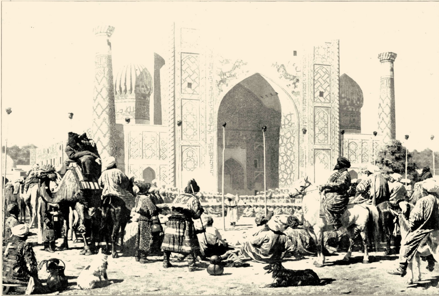
TERDOODBRENGING VAN MISDADIGERS VOOR DE REGNISTAN-MOSKEE IN SAMARKAND (MUSEUM TRETJAKOF, MOSKOU)