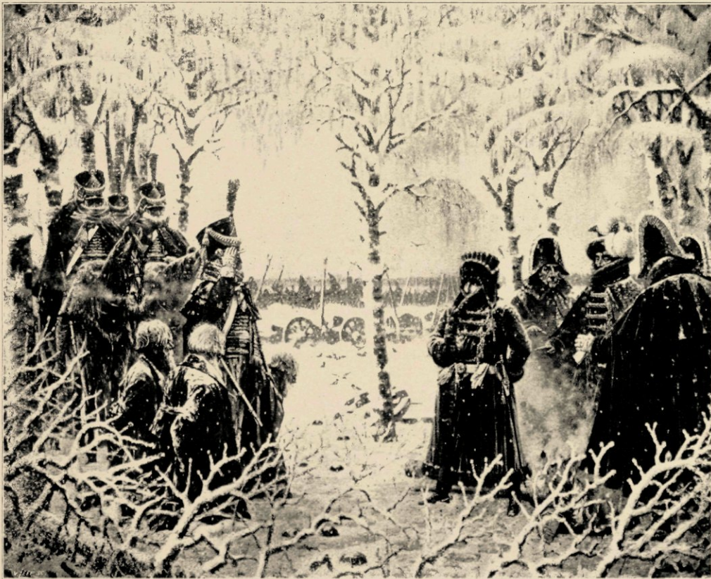
RUSSISCHE FRANC-TIREURS WORDEN OPGEBRACHT. NAPOLEON ZEGT: „MET DE WAPENS IN DE HAND GEVAT? DAN DOODSCHieten.”

In 1900 heeft hij nog eens een reis onder-