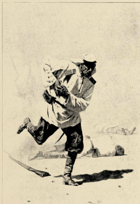
DOODELIJK GEWOND (Museum Tretjakof, Moskou).

voor de uitvoering der groote plannen, die hij ontworpen had. Daarom keerde hij nog eens weer naar Toerkestan terug, dringt op een avontuurlijke reis vol gevaren tot diep