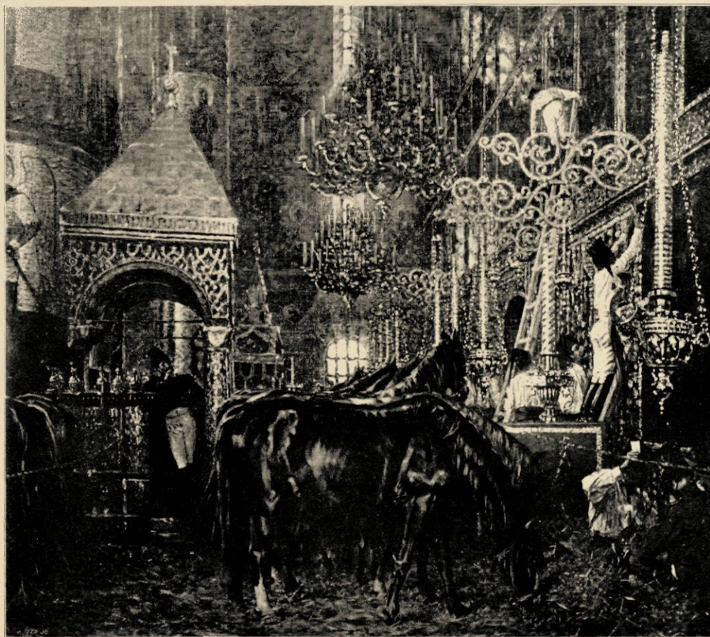
DE OESJENSKI-KATHEDRAAL IN MOSKOU TOT PAARDENSTAL INGERICHT (Museum Alexander III. St. Petersburg).

ook duidelijk hoe nabij hij de ellende gezien heeft. Hij schrijft ergens: „'t Is moeilijk weer te geven, met woorden te schilderen, wat een gevecht of de hitte van een gevecht eigenlijk is, omdat iedere minuut daarbij wat nieuws gebeurt. Niet alleen op mij, maar op iederen deelnemer werkt het opwindend. De menschen worden gewoonweg krankzinnig, schelden en schreeuwen zoo, dat als de slag voorbij is, van den generaal tot den soldaat toe, allen heesch zijn. Ofschoon men zich laat meesleuren door de opwinding en woede van 't gevecht,