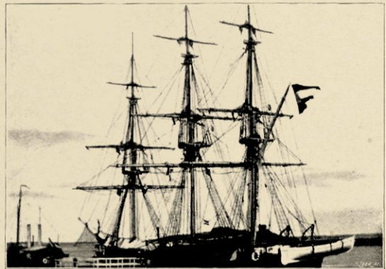
DE „URANIA” AAN DEN STEIGER.