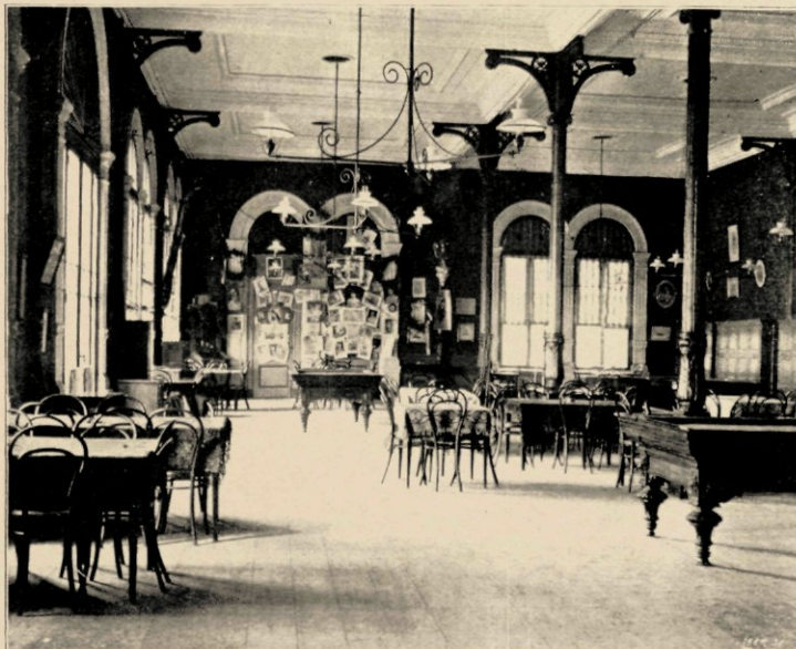
EEN DEEL VAN „HET ZAALTJE”; OP DEN ACHTERGROND DE OUDSTE-JAARS-HOEK.

Zoodra men binnentreedt, komt men in de ruime vestibule, waar we de groote schilderijen van de Ruyter en Maarten Harpertsz. Tromp en verder die van de Buffel, Tijger, Wilhelmina en een zeilend fregat vinden. In glazen kasten staan twee langsdoorsneden van een fregat; een model van een oud fregat „de Batavier” (met 60 stukken) door den heer Boelen vervaardigd en aan het Instituut ten geschenke gegeven; een model van een oud fregat van vóór 200 jaar (met 24 stukken) en verder van het pantserdekschip „Gelderland”. De twee modellen van de oude fregatten zijn bijzonder nauwkeurig afgewerkt, terwijl het model van de „Gelderland” een waar kunststuk is. Men kan er, tot in de kleinste bijzonderheden toe, alles op vinden. Het heeft op de tentoonstelling van Düsseldorf zeer veel bekijks gehad, daar dit schip kort