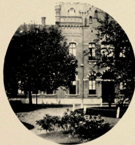
RECHTERZIJDJE VAN DEN „KNOLLENTUIN” (VOOR-TERRAIN).

»Stervend zullen wij haar schragen, maar die vlag verlaten, nooit!»,