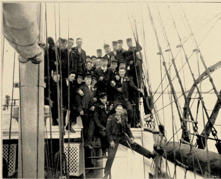
NA EEN DINER OP DE CAMPAGNE VAN DE „URANIA”.

De adelborsten 3 e klasse moeten, om tot adelborsten 2 e klasse bevorderd te worden, een eindexamen afleggen in talen, geschie-