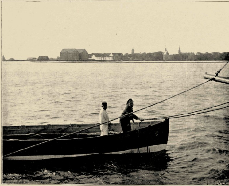
SLOEP BEZORGEN AAN DE BAKSPIER.

belangen van het Instituut, terwijl het geldelijk beheer wordt gevoerd door een officier der administratie der 1 e klasse.