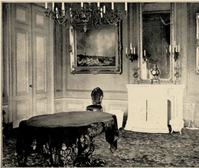
EEN HOEK VAN DE RECEPTIE-ZAAL.

Loopen we vanuit het zaaltje den corridor door, dan komen we in de receptiezaal. Deze zaal is ook wederom versierd met schilderijen, n.l. twee pendanten van den heer Schotel, voorstellende de kanonneerboot van Van Speyk voor Antwerpen en het oogenblik, dat de commandant, den dood boven de schande van in 's vijands handen te vallen verkiest en met vriend en vijand in de lucht vliegt. Verder een schilderij, waarop we den grootsten van Neerlands helden, de Ruyter, gewond op het dek van zijn schip zien liggen. De