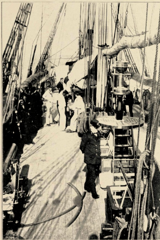
DE BAKBOORDZIJ VAN DE „URANIA”.

in stoomwerktuigkunde aan het Instituut werkzaam, bekleedt thans die gewichtige betrekking; een raad van toezicht behartigt de