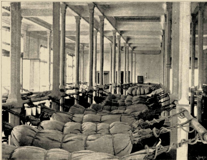
SIAAPZAAL MET GESJORDE KOOIEN.

verder nog 4 jekkerkamers, 2 afdeelingen, 1 wapenkamer, 1 bibliotheek- en muziekkamer, 1 stoom- en torpedozaal en 1 wachtkamer. Verder zijn hier nog kamers ingericht