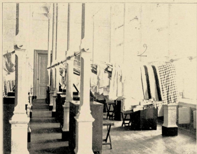
SLAAPZAAL, KOOIEN OVERGEHANGEN.

Bezoeken we eindelijk de bovenste verdieping, dan zijn de koffers, de waterresevoirs, de oude tekenzolder, een kamertje met tijdmeters, barometers en thermometers het minst van belang, maar zijn het vooral de kleine aparte kamertjes, die aan de damesbezoekers van het Instituut menig „ach,” „och,” en „kasian” ontlokken. Deze kamertjes schijnen een bijzondere attractie voor de heeren adelborsten te hebben. Wanneer men deze hokjes dan ook gesloten vindt, kan men er