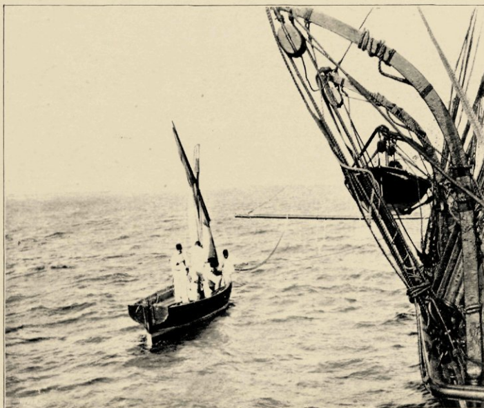
SLOEP OPTUIGEN MET MODELTUIG.

ze reeds van Juni tot half Juli op de Urania en de Ever doorgebracht en evenzoo in hun jongste en 3 e jaar, 14 dagen met de Urania gevaren.