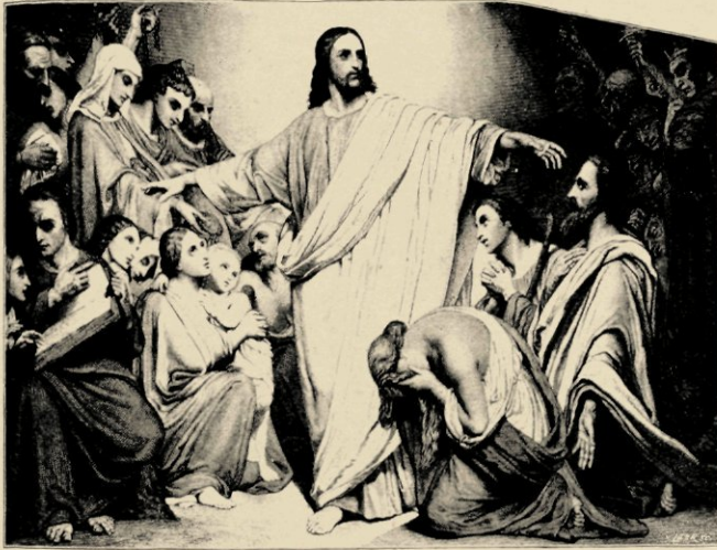
CHRISTUS REMUNERATOR (NAAR EEN GRAVURE)

voit cette vérité si frappante d'expression chez les anciens peintres Allemands, cette perfection de forme et de beauté chez les Italiens. puis l'exécution forte et saississante des peintres Hollandais, je sens que je suis un Mittelding , et cela, je n'aurais pas dû l'être; et je tâcherai du moins de ne pas le rester dans le peu que je pourrai produire encore".