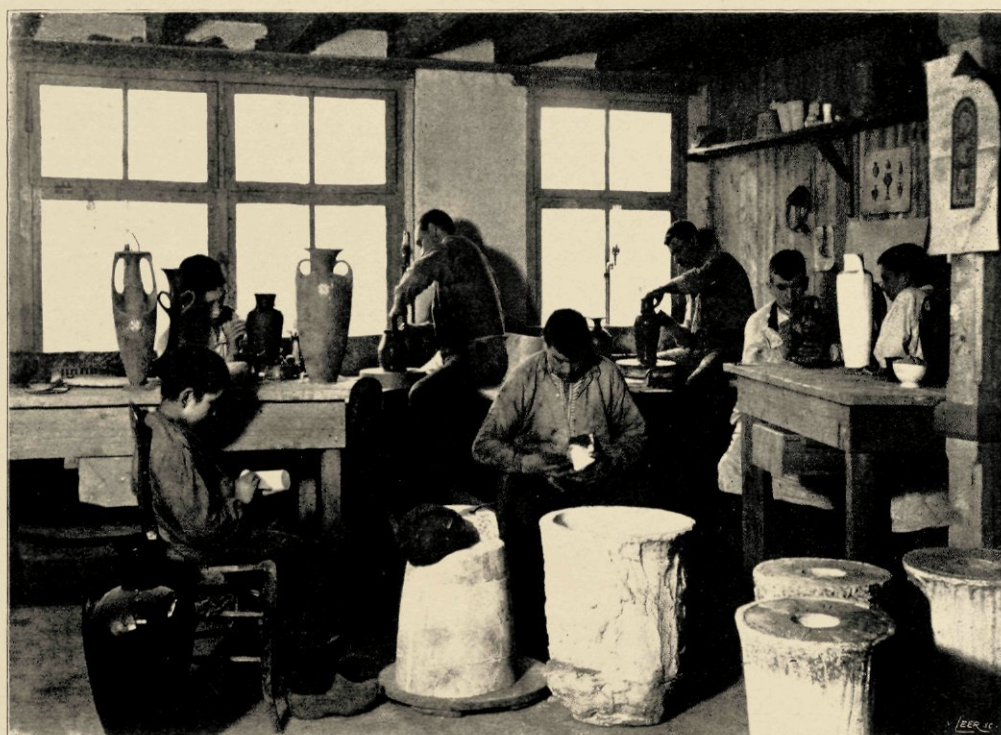
'T MOETEN MENSCHEN ZIJN DIE LUST HEBBEN VOOR MOOIE LIJNEN.

plaats teelde hij het teere plantje op tot het daar zou staan als een lust voor zijn oogen.