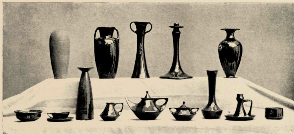
OVERAL RONDOM ONS ZAGEN WE KANNEN EN PULLEN, POTTEN EN SCHOTELS.

Hij toonde ons de grootste vaas die hij tot nog toe gemaakt had. — Mocilijk werk, zei hij, zoo met de hand heb ik 'r opgewerkt, zat ik er ten leste met m'n blooten arm in tot aan de oksels. Die rand van boven is iets te smal, dat zie-je-wel. Anders nog al geslaagd zei hij en keek tevreden naar het kunstvoorwerp in diep donker-groen glazuur met 'n enkele kleine versiering op den teer welvenden buik zoo glad en lijnig zoo gevoelig fijn bewerkt dat er het leven van den artist uit spreekt en bij het aanstrijken is 't of er de toppen der kunstvaardige vingers den stempel van mensch-arbeid ingedrukt hebben.