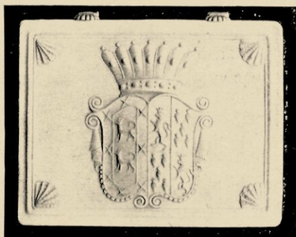
WAPEN VAN HET GESLACHT LOPEZ SUASSO, IN IVOOR GESNEDEN OP DEN DEKSEL VAN EEN FICHESDOOS.

In het rijtuig zaten drie oude dames, alle-eenvoudigst gekleed, te dommelen. Ware het