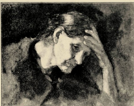
„OUDE VROUW” (STUDIEKOP) NAAR EEN AQUAREL

Zie eens die Studiekop van een oude vrouw , een aquarel van bijzonderewaarde. Een heele geschiedenis leest men erin! — Die smartelijk-peinzende trekken, die uitdrukking van lijdzaam lijden der arme vrouw.... Het is