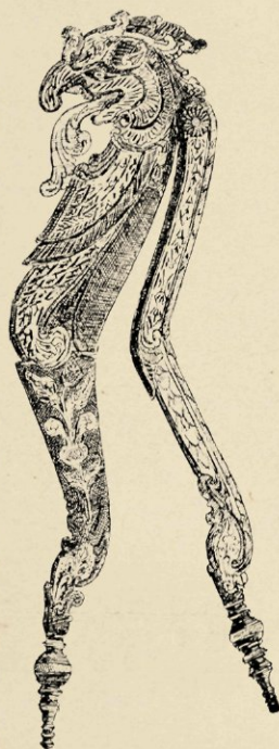
N o . 8. KATJIE. L. 21 CM.

Rest ons nog te spreken over de wapens waarvan wij er slechts een willen beschrijven, een kris, een waar juweel van vinding. Verrukkelijk is de combinatie van goud en koper hierbij toegepast. De schede is van donkerbruin hout, omwikkeld met gladde roodkoperen banden boven en beneden afgesloten door