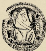
N o . 491. VERSIERSEL PAARDENTUIG IN ZILVER.

een rand van kleine robijntjes, die het vlak uitmuntend afsluiten zonder de aandacht van het hoofdornament af te leiden. Daarnaast een zilveren oorversiering, waarop een curieus ornement van gebrokkelde stukjes zilver en langbeenige driehoekjes die aan sarongmotieven doen denken, teer en smaakvol. Tot