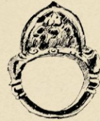
N o . 485. GOUDEN RING 3.5 CM.

Onder de arm- en beenringen trekken het eerst onze aandacht, die welke zich bevinden onder de bruidsieraden uit de Pasoemah-landen, bekend door de fraaie rotanmatten, die te Palembang door hunne bewoners worden te koop geboden. Eigenaardig is van deze beenringen de ornamentatie, de lijnen staan wel is waar scheef in het ornament, maar maken er toch vreemd genoeg een geheel mee uit. Iets dergelijks, ook in vorm waarbij het driehoekige figuur hoofdzaak is, vinden wij terug bij een ijzeren met rood-goud-blad bekleeden beenring en op de zijkanten van twee evenzoo samengestelde, ook uit Lombok afkomstige armringen. Bij de twee laatste bestaat het ornament uit een reeks van schuin tegenover elkaar gestelde blaadjes, die met de zijranden driehoekjes vormen; op de platte vlakken een reeks van zeer bizon-