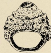
N o . 266. GOUDEN RING. LOMBOK. 3 CM.

der gevormde diepgedreven krulornamenten, waarin men den vorm van een lier meent te erkennen. Indien de eerstgenoemde beenringen werkelijk uit Pasoemah — zooals de catalogus zegt — afkomstig zijn, dan is de overeenkomst met het Balineesche werk des te merkwaardiger. Het meest komt overigens bij de armringen de slangenvorm voor. Zoo bij een betrekkelijk modernen armband (No. 49) waar de staart van de slang herhaaldelijk om den band gewonden is, hetgeen een zeer rijk effect maakt, de diamant in den overigens fraai bewerkten kop is wat kolossaal en doet afbreuk aan 't geheel, is er misschien wel later aan bevestigd; eveneens bij een armband van Padang's fabrikaat (No. 336), de slang geheel bedekt met even aangegeven schubbetjes, door zijn eenvoud een