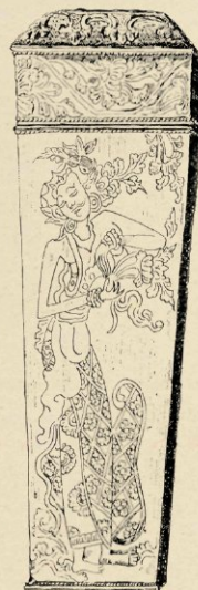
N o . 57. STROOTJESKOKER. LOMBOK. H. 16 CM.

Maar er is meer. Van de meest primitieve metaalbewerking in koper — zie bijvoorbeeld de koperen applique (No. 143) waarop de poging tot ornamentatie door een kind, dat nog niet verder dan de hanepooten is gekomen, schijnt gekrabbeld te zijn — goud en zilver, tot het hoogst verfijnde drijf- en ciseleerwerk, behoorende tot het fraaiste, wat er ooit gemaakt is, en nog wel van de meest verschillende streken uit onzen Archipel, vinden we hier een of meer exemplaren voorhanden, vooral in edel