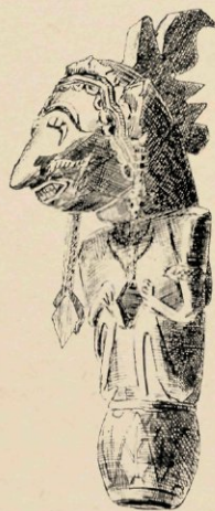
N o . 145. STOKKNOP VAN ZILVER, LOMBOK.

zich komiesch voordoende figuren, misschien de symbolische voorstelling van het Javaansche volksleven, en niet te vergeten het eigenaardige lampje in den vorm van een vogel met menschenhoofd. Of het eenvoudig een afbeelding is van een Gardharva — Buddhistiesche engel — of ook wel van Garuda de phoenix, de adelaar van Vischnu, die veelal voorkomt in menscheelijke gedaante met vogelsnavel, is niet zeker. De Gobogs in den vorm van munten (no. 620 en 21) met wajangachtige figuren, zijn volgens de laatste onderzoekingen, geen tempelmunten zooals de catalogus zegt, maar amuletten. Onder het bij den ritus gebruikelijke vaatwerk munten vooral uit een paar zilveren wijwaterkommen met uiterst