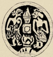
N o . 620. TEMPELPENNING 15 e EEUW, DIAM. 45 CM.

chine. Misschien is het de afbeelding van de godin »Tara, de witte» de vergoodde chineesche prinses Wench'eng, de echtgenoot van