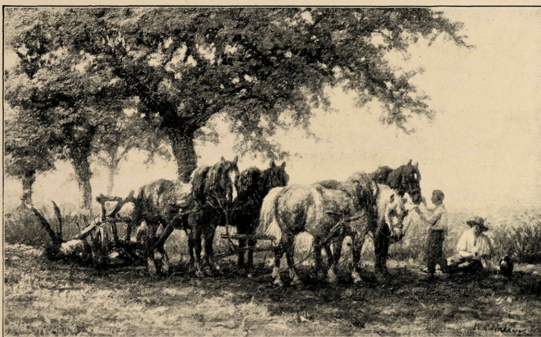
Rustend ploegspan in Normandië (naar een schilderij in het bezit van H. M. de Koningin).