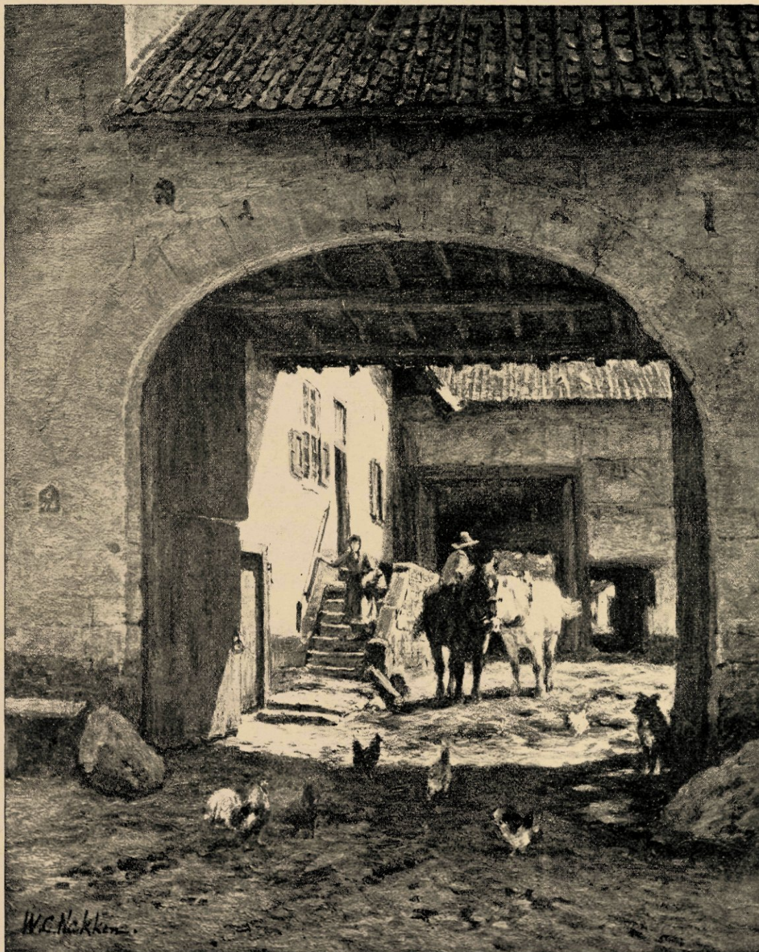
Ingang eener boerderij in Zuidelijk Limburg (naar een schilderij, thans in Engeland).

belet dit op wagens te vervoeren. Een groot winterlandschap, gestoffeerd met paarden, die bij de hut in 't bosch gevoederd worden, vóór het vertrek naar de plaatsen, waar het hout geveld ligt, werd in 1876 op de Internationale