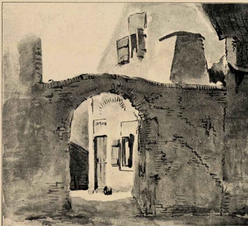
Oud dorpsgezicht in Rijswijk Z. H. (naar een studie in sepia).

Nakken had er ook menig avontuur, vooral tijdens zijn eerste reizen, toen