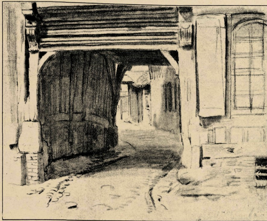
In Honfleur (krijtteekening).

Veel tot Nakken's succes heeft ook meêgewerkt het Huis Goupil, waarvoor