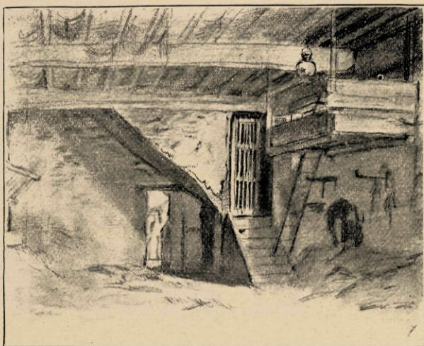
Paardenstal (naar een studie).