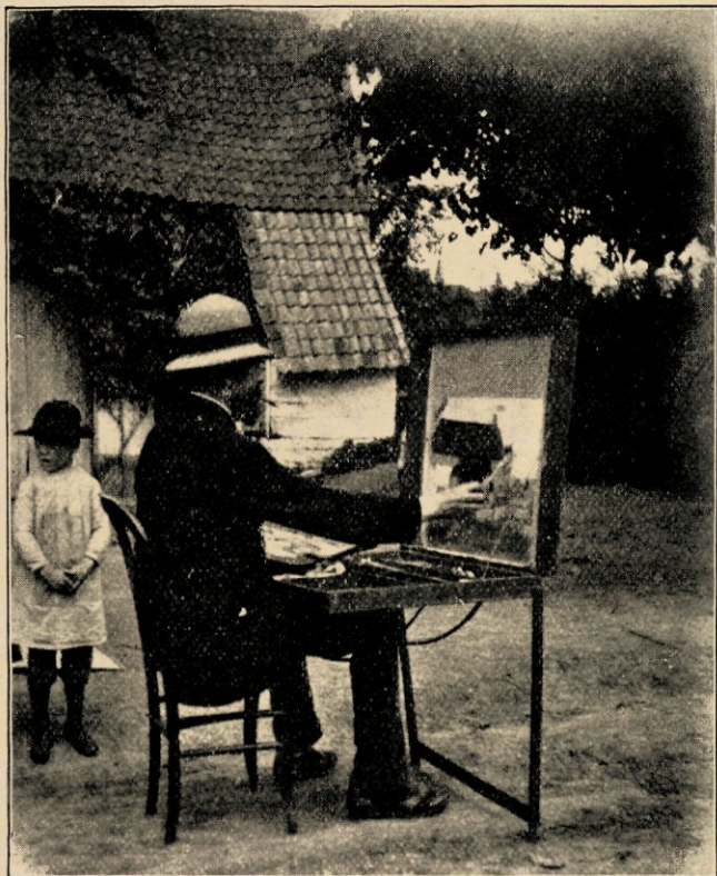
De schilder aan den arbeid bij Houthem, in Limburg (naar een instantané).