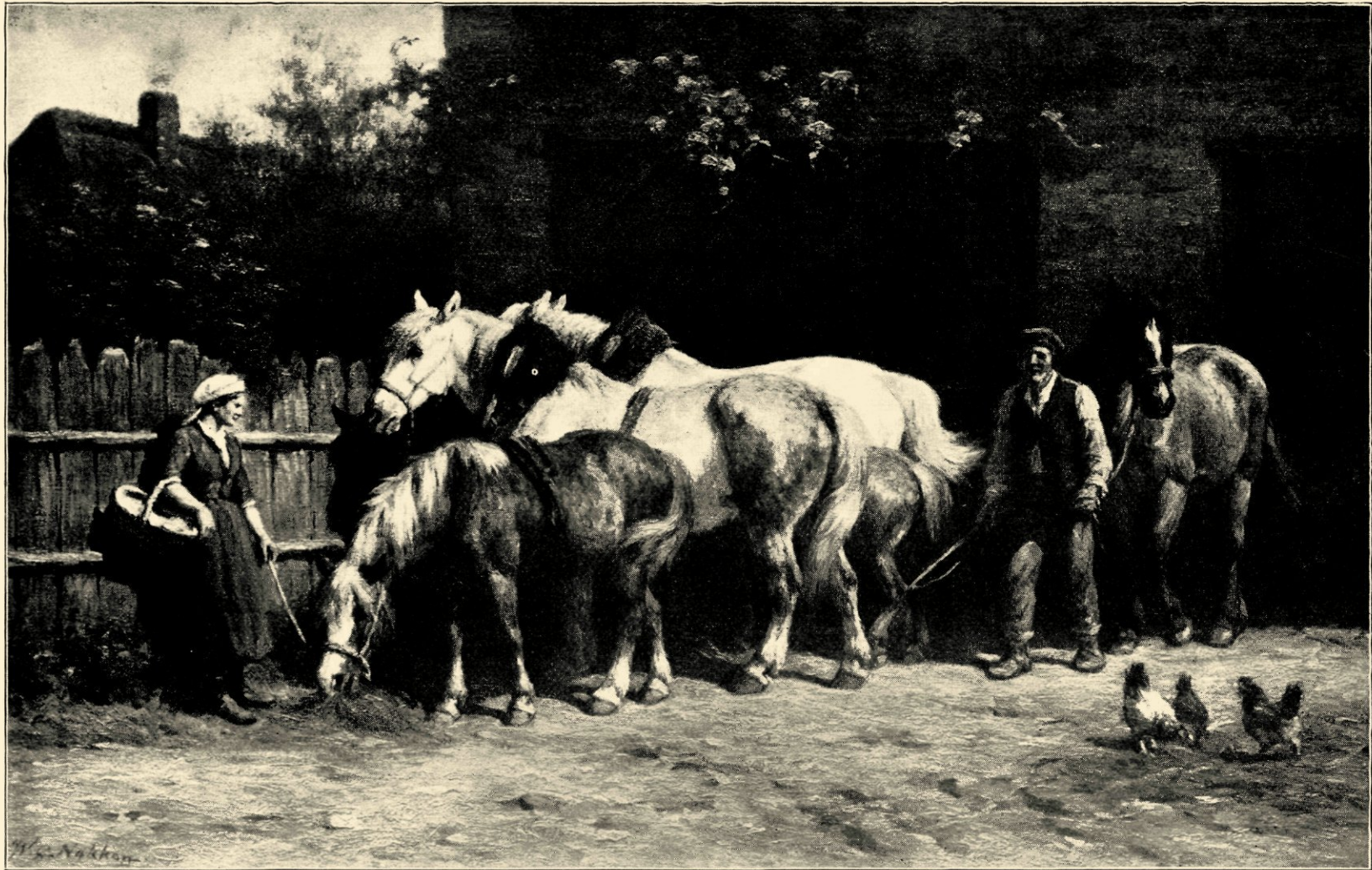
Uitspanning op marktdag te Trouville (naar een schilderij, eigendom van H. M. de Koningin-Regentes).