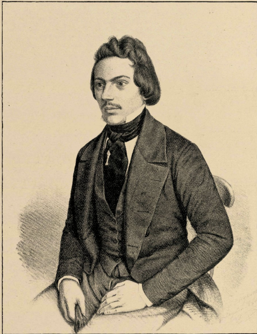
Portret van Mr. Alex. Ver Huell op 27jarigen leeftijd.

Met den persoon van Mr. Alexander Ver Huell, in den loop van het vorig jaar te Arnhem overleden, is een dier oorspronkelijke talenten ten grave gedaald, gelijk ieder land er slechts weinige zal voortbrengen, omdat daartoe eene vereeniging van gaven wordt vereischt, zoo als slechts zeldzaam voorkomt. Hij is een dier tweeslachtige wezens geweest, die evenzeer tot de familie der letterkundigen als tot die der beeldende kunstenaars behooren,