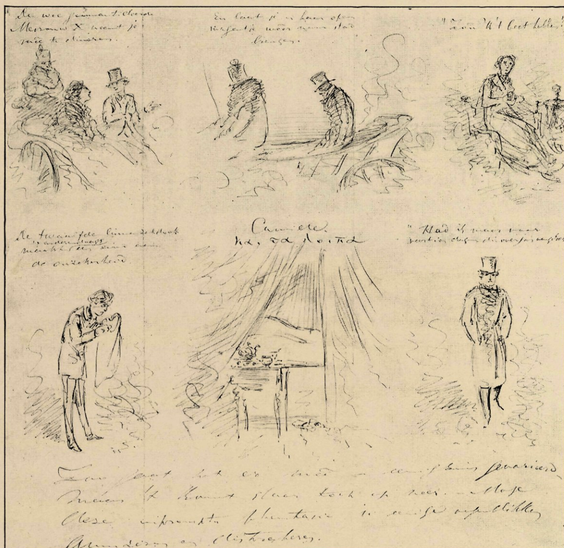
Fragment van een brief.

schrijven, om tot doctor in de letteren te worden bevorderd. Hij kleepte zich op losse, artistieke wijze en wist de pet „onnavolgbaar coquet” zooals de Génestet zich uitdrukt, op zijn lange haren te plaatsen. Met de handen op den rug en den stok in verticale richting tegen zijn schouder geleund, flaneerde hij, volgens de beschrijving van een zijner tijdgenooten, langs Breestraat en Rapenburg, de oogen rechts en links gewend, of er iets van zijn gading viel waar te nemen, gewoonlijk door een dog gevolgd, die hem op zijn hielen nasloop en een zacht gebrom liet hooren, als men een schuinschen blik op den „baas” wierp, alsof hij zeggen wilde, stoor den man niet in zijn opmerkingen. Er waren enkelen onder zijne medestudenten, die hem in zijn uiterlijkheden trachtten na te bootsen en die, zooals hij, een pet van vreemd model droegen, alsof het geheim zijner talenten in dit exentriek hoofddeksel verscholen lag. Hij werd overigens tot de zoogenaamde „zonderlingen” gerekend, met een zekere neiging tot eenzelligheid, die op lateren leeftijd in