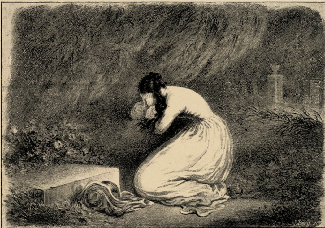
Hoe zij dorst te bidden. (Uit „Zijn er zoo I”).

Jan van Beers en Van Dam van Isselt hebben bij sommige dezer voorstellingen berijmde verhalen geschreven, een tamelijk overbodig werk, waar de platen voor zich zelve duidelijk genoeg spraken. De Darwin-theorie gaf hem aanleiding tot het teekenen van eenige geestige spotprenten, zooals in later tijd het spiritisme en de tafeldans, terwijl hij somtijds bij onze blijspel-dichters is te gast geweest. Zoo is de voorstelling van den bediende, die, met een kaars in de hand, aan twee welgedane heeren op hun embonpoint de maan-eclips verklaart, aan Langendijk's „Wiskunstenaars” ontleend, waar een dergelijk tooneel beschreven wordt. Hij zoekt zijn kracht voornamelijk in de tegenstellingen, die somtijds op één plaat, soms in meerdere ons worden