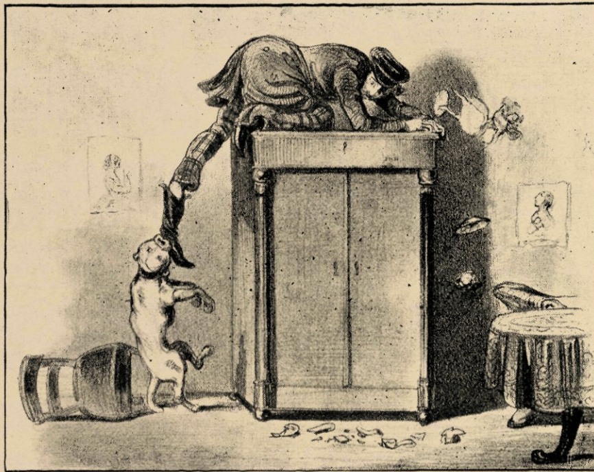
Een vriend die zijn vriend bezoekt, door een vriend van zijn vriend ontvangen. (Uit „Zoo zijn er II”).

Wanneer de mensch zich in een abnormalen toestand bevindt, komt gewoonlijk zijn natuurlijke aard te voorschijn, zoodat het „in vino veritas” steeds een gulden waarheid bevat. Hij beweert niet ten onrechte dat hij nooit de grenzen der kieschheid is te buiten gegaan. Bij de voorstellingen onzer oude meesters vergeleken — men denke aan sommige schilderijen van Brouwer, Ostade, Molenaar en Jan Steen, die hij blijkbaar gekend heeft, moet men erkennen dat Ver Huell's schetsen, hoe realistisch zij somtijds mogen zijn, ons gevoel nooit kwetsen of beledigen. Sommigen zijner geestigheden, zoo als het bekende „U studeert mijnheer? Ik ben student, Mevrouw” deden de ronde en werden tot een bon mot in de gezelschappen. De schetsbundel „de Visch en de Mensch” bevat eveneens herinneringen aan de akademiestad en hare