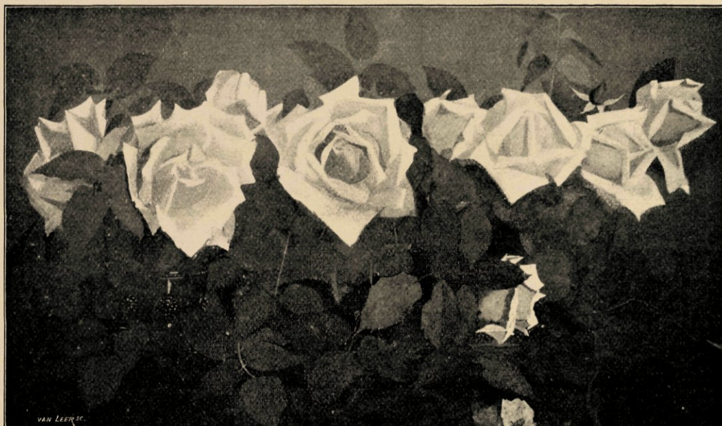
Rozen. Naar een aquarel in het bezit van mevrouw A. Reich—Timmers te Amsterdam.

Er zijn in de Midden-eeuwen dan ook de twee soorten landschappen van de twee soorten verbeelding.