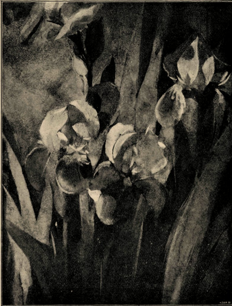
Iris. Naar een aquarel in het bezit van den heer J. W. M. Roodenburg te Amsterdam.

En een schoonheid zuiverst in den stijl, en zuiverst naar de uitdrukking van de personen, zijn de zwanen, op de beken en vijvers zwemmend.