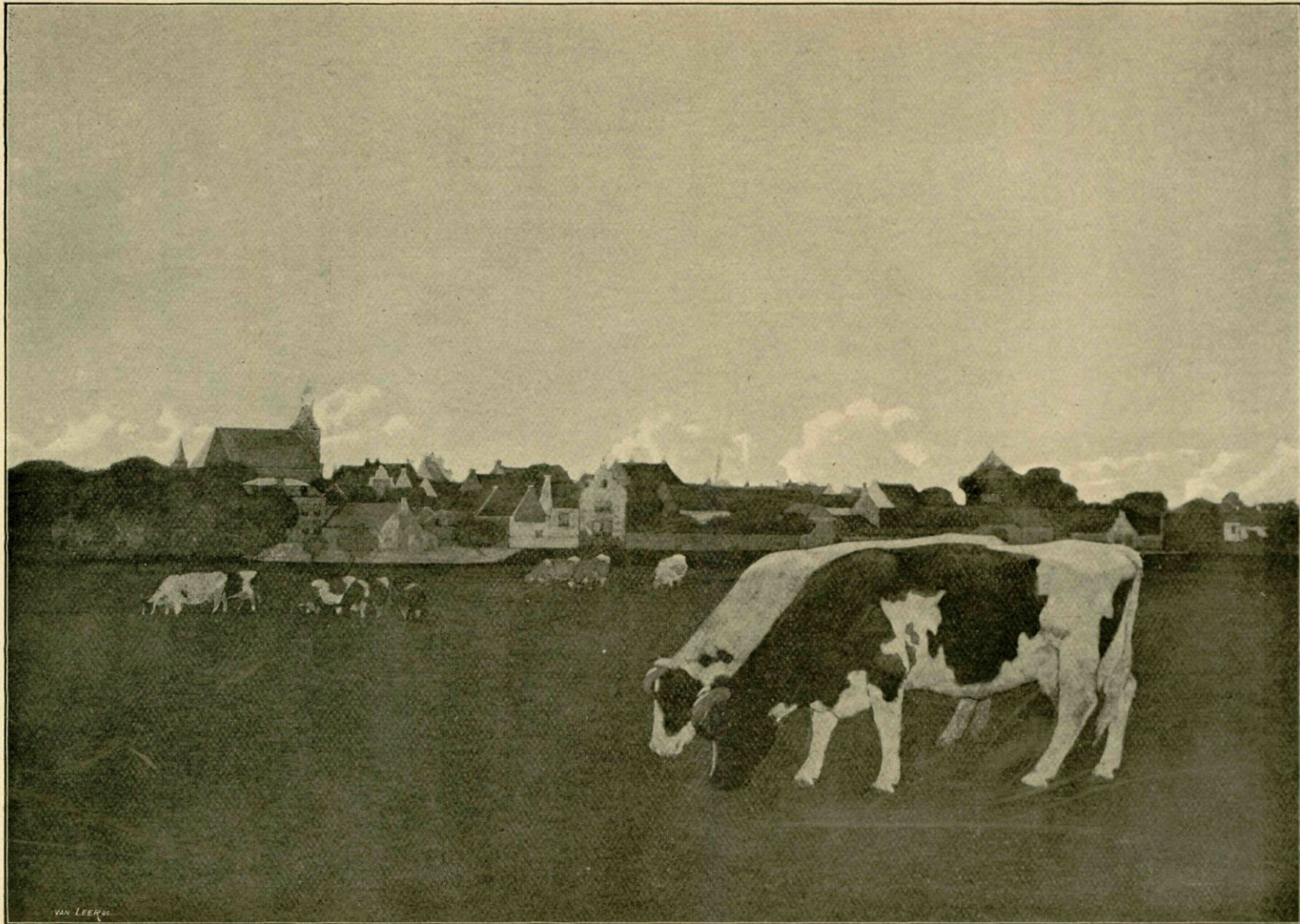
Hattem. Naar een aquarel in het bezit van den heer C. Hoogendijk te 's Gravenhage.