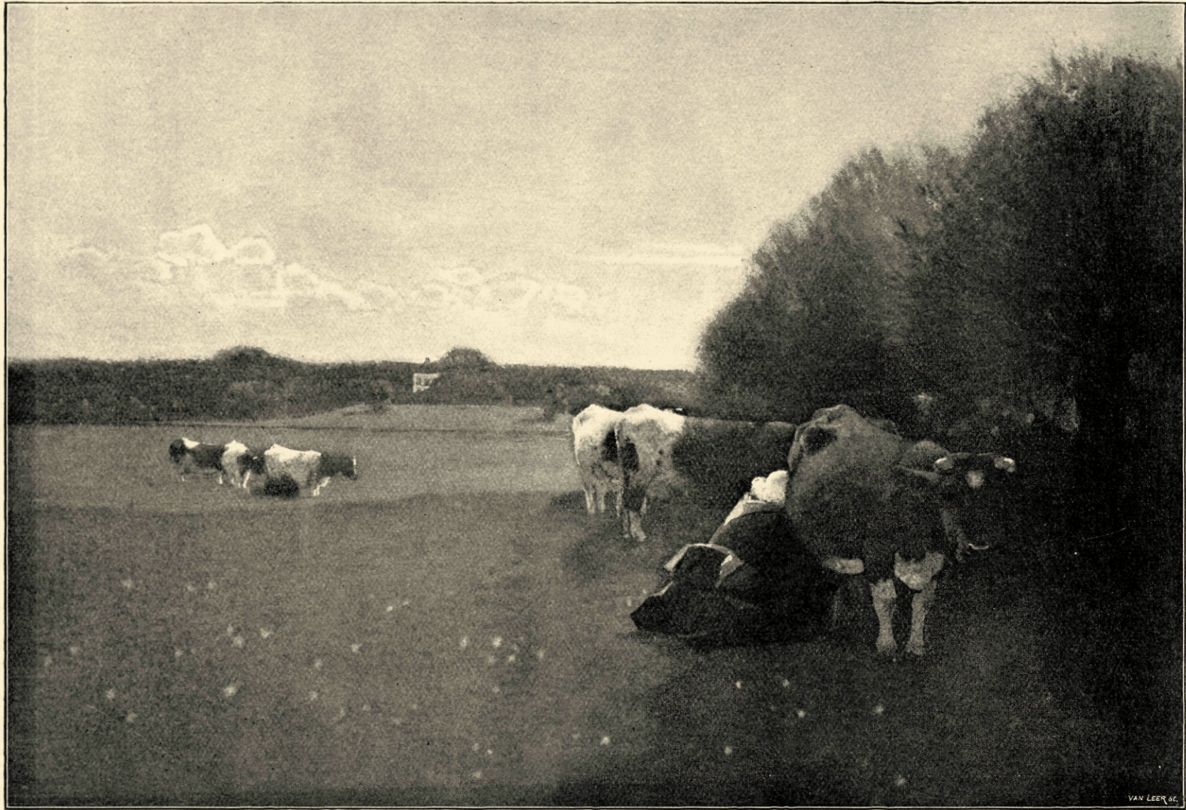
Melkuur. Naar een aquarel in het bezit van den heer v. D. te Amsterdam.