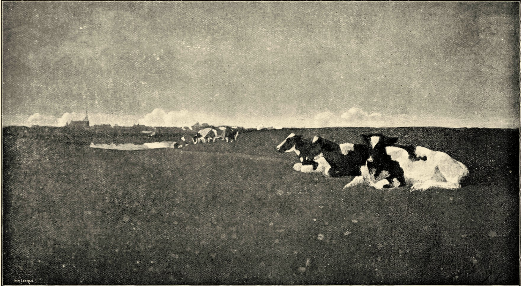
Langs den IJsel. Naar een aquarel in het bezit van Mr. H. K. Westendorp te Amsterdam.