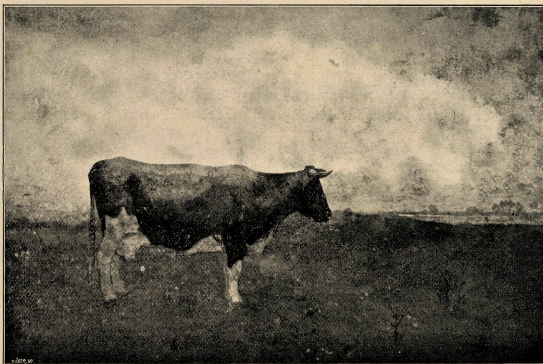
Zwarte koe. Naar een aquarel in het bezit van den heer J. T. Cremer te 's Gravenhage.

De vrouw staat vooraan. Ze lacht in haar bizarre verrukking, perverse; maar ook als avonden in herfst zijn. En in dezelfde vreemdheid van lachen als van een wiskundige , die de hoogste schoonheden zou vinden; wiens lijnen voor zijn bewijzen, als voor andere gezangen zijn; en die zou meenen iets te vinden dat nog niet gevonden was — maar daarachter zou dan weten plotseling — nog verdre streken, die hij niet gaan; en zou lachen om zijn eigen hulpeloosheid.