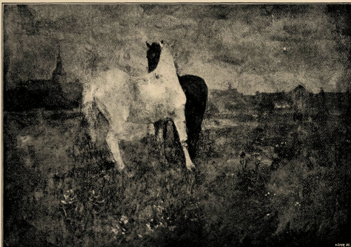
Noppende paarden. Naar een aquarel in het bezit van den heer C. Hoogendijk te 's Gravenhage.

Zie maar: zoo 'n lijnbuiging van de pooten van stoelen uit dien tijd —