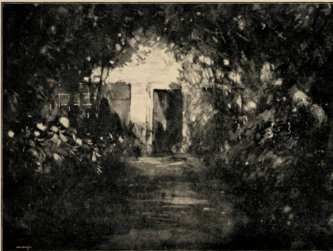
Het sprookjeshuis. Naar een aquarel in het bezit van den heer C. Hoogendijk te 's Gravenhage.

De Renaissance was vooral 'n zinnelijkheid; een zwierige en vrije zinnelijkheid; eene groote en zware hartstocht zeldzamer.