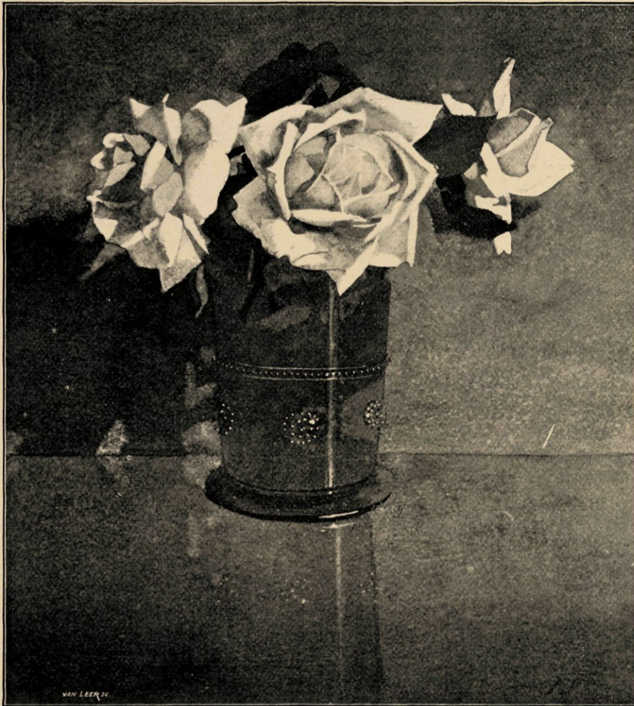
Glas met rozen.