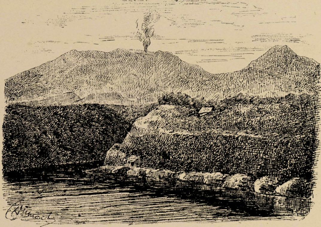
De „Gedeh” en de „Pangeranghoe”.

te waardeeren eigenschap, dat zij een ieder op hunnen rug dulden, hetzij een kenner, hetzij een leek in 't vak; vandaar dat de minst koene ruiter of ruiters zich onbeschroomd op die edele dieren waagt. Het zijn bergpaardjes in de ware beteekenis van het woord, zoodat het bergpad al heel steil en onbegaanbaar moet zijn, voordat dit de beestjes afschrikt. Dat het organiseeren van kortere of langere rijtoertjes, soms met twintig tegelijk, hiervan het gevolg is, behoeft geen betoog. Dan gaat het òf naar den ontbijtberg (een hooge heuvel op een uur afstand van het établissement en door de gasten zelven met dien naam gedoopt), òm daar het medegenomen ontbijt te nuttigen, òf naar den bergtuin te Tjibodas , een zeer mooie door het gouvernement onderhouden tuin, behoorende tot het buitenverblijf van Z. E. den gouverneur-