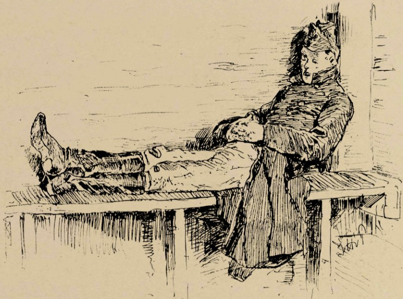
De kanonnier volgt dat verleidelijke voorbeeld, en maakt het zich gemakkelijk in een hoek.

houten plank, die voor bank dient; in het midden staat een langwerpige tafel: een paar vlotdelen, rustende op vier staanders, die in den grond zijn geplant. In een der langsche wanden, die, welke gekeerd is naar het schietterrein, bevindt zich een lange horizontale sleuf, het begin van een platte