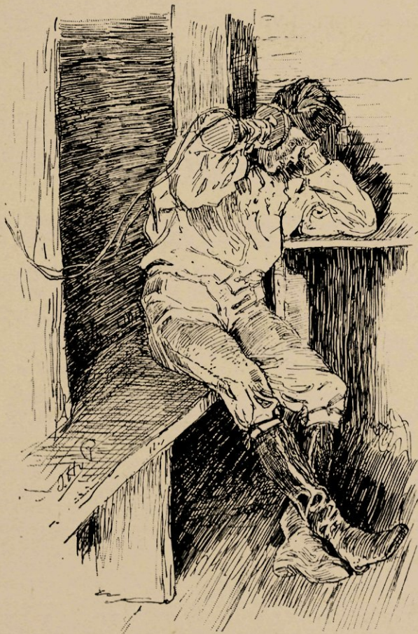
De telefonist gaat weer dommelen, maar nu met het instrument tegen een oor gedrukt.