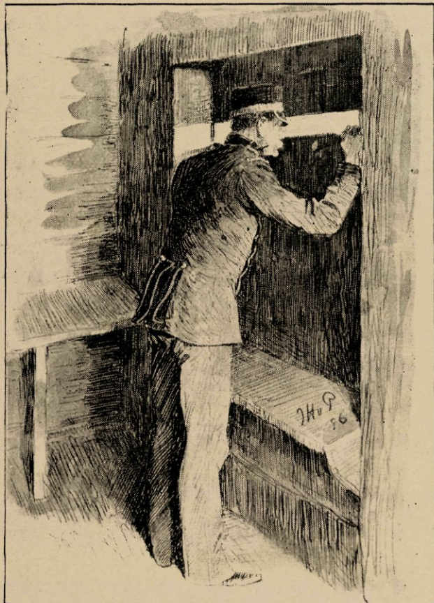
Door de horizontale sleuf neem ik een overzicht over mijn observatierrein.

En dan dreunt uit de verte het kanonschot, een poosje na de nederhagelende granaat-kartetskogels en neerploffende granaten.