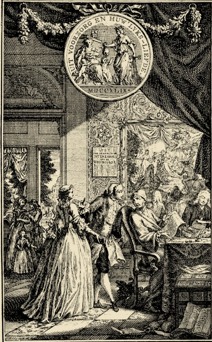
Ter Oprichtinge van de Weduwenbeurzen in 't jaar 1749.

uitgaf onder den den titel: „Proeven van politieke rekenkunde." Hoeveel er ook op Kersseboom is aan te merken als een te heftig en vaak onbillijk polemiker en hoezeer zijn wijze van redeneeren dikwijls moet worden afgekeurd, toch is hij door deze „Proeve" beroemd geworden, want daarin geeft hij de