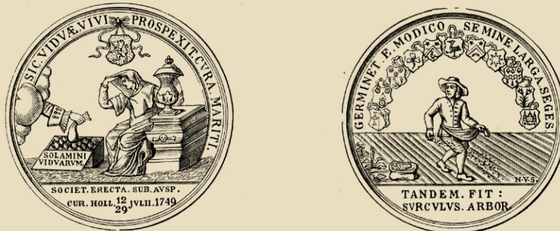
Afbeelding van een medaille betrekking hebbende op een in 1749 te Amsterdam opgerichte weduwenbeurs.

op groote waarnemingen gegronde „Tafel van Levenskracht.” Hoe hij echter aan die waarnemingen is gekomen, is nog niet opgehelderd en misschien is het waar, wat de „Algemeene” in hare meervermelde „Bouwstoffen” vermoedt, dat hij gebruik heeft gemaakt van de door de Witt gedane berekeningen, welke voor ons verloren zijn gegaan.