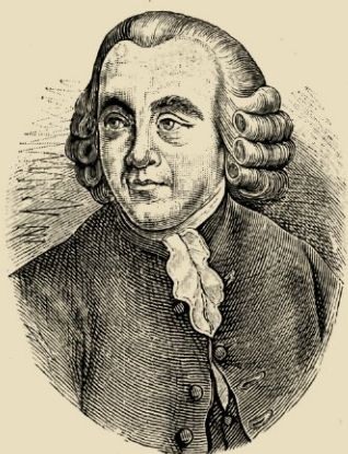
J. H. van Swinden.