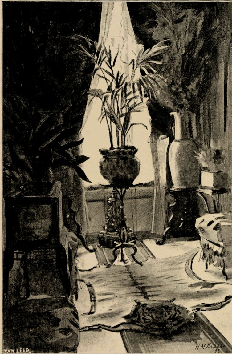
De bovengang in de woning van den heer Wertheim.

„Want — dat kan ik u wel zeggen... het kan u misschien interesseeren — het is een zwak van mijn karakter, dat ik nooit neen kan zeggen. Alsmij iets wordt opgedragen dan kan ik niet weigeren en waar ik moeilijkheden zie, tracht ik die niet te ontgaan, maar ze te overwinnen. Ik beschouw mijweleens als een van die honden, die zonder eenig nadenken in 't water springen om hun