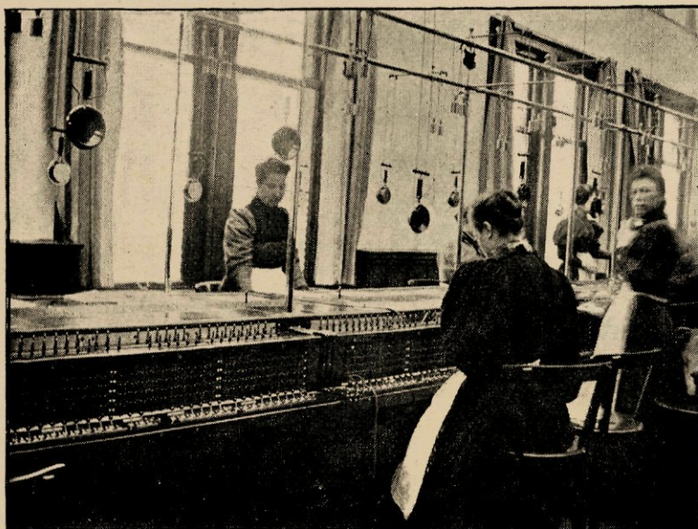
Gezicht op de Multiple-tafel.

Dit was het enkelvoudige stelsel: op elk schakelbord kwam slechts een bepaald aantal nummers voor, zoodat het in de seinzaal steeds een druk