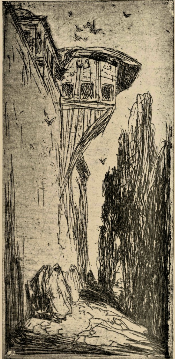
Muur van het Serail (Ets).

Daar ik Bauer sedert zijn debuten heb gekend, en steeds zijn évolutie heb