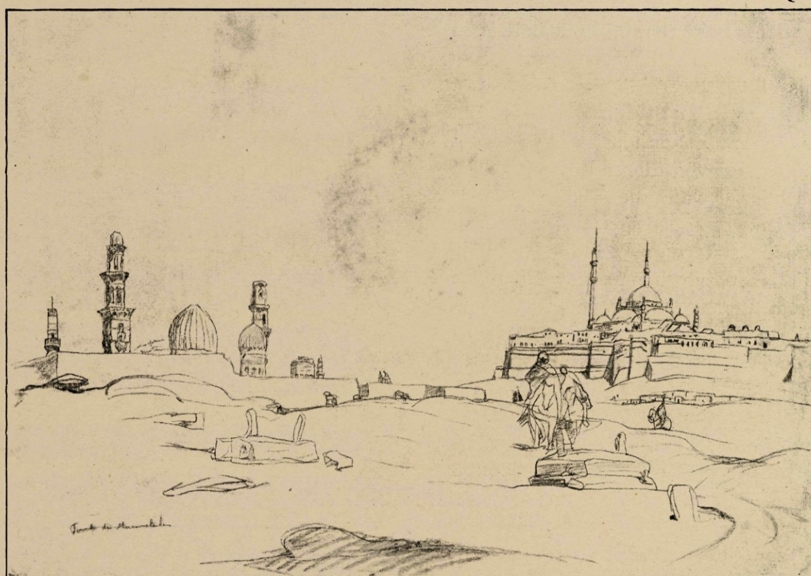
Krijttekening naar de natuur (Egypte).

Met zulke teekeningen heeft Bauer eenige maanden geleden een schitterend succès behaald op de laatste tentoonstelling van Arti et Amicitiaë . Daar had