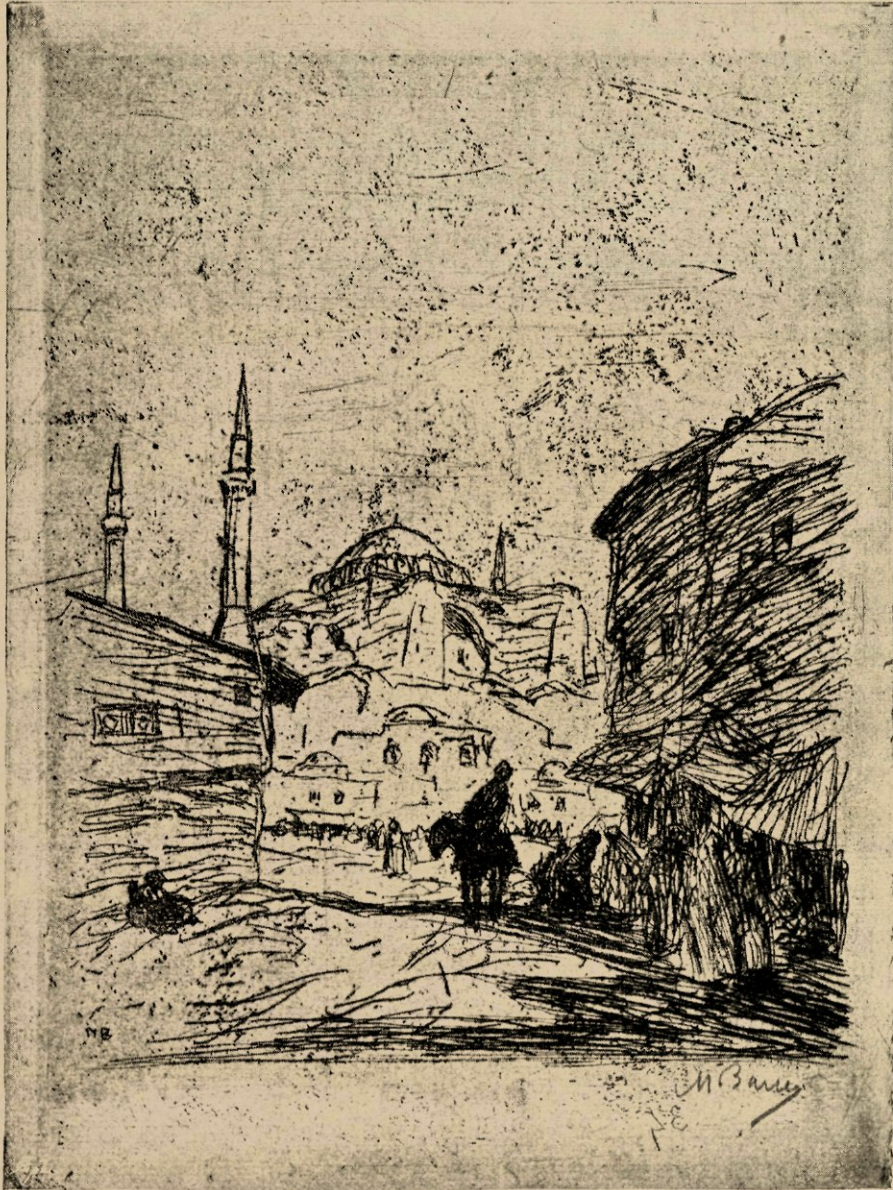
Straatje in Stamboel (Ets).

Zoo bracht hij jaren door met zoeken, slechts weinig produceerend. Weer