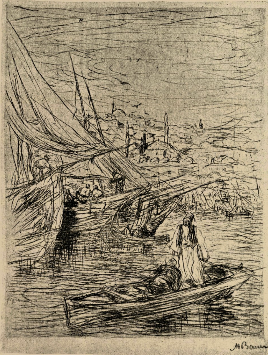
De Gouden Hoorn (Ets).

In dezen aanleg voor composeeren, voor het schikken van talrijke figuren, en in die liefde voor de Duizend en Een nacht, vindt men geheel de genesis van zijn eigenaardig talent terug.