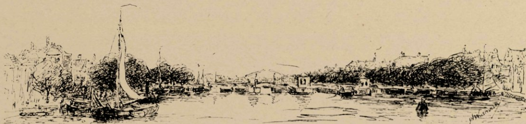
Gezicht op den Binnen-Amstel.