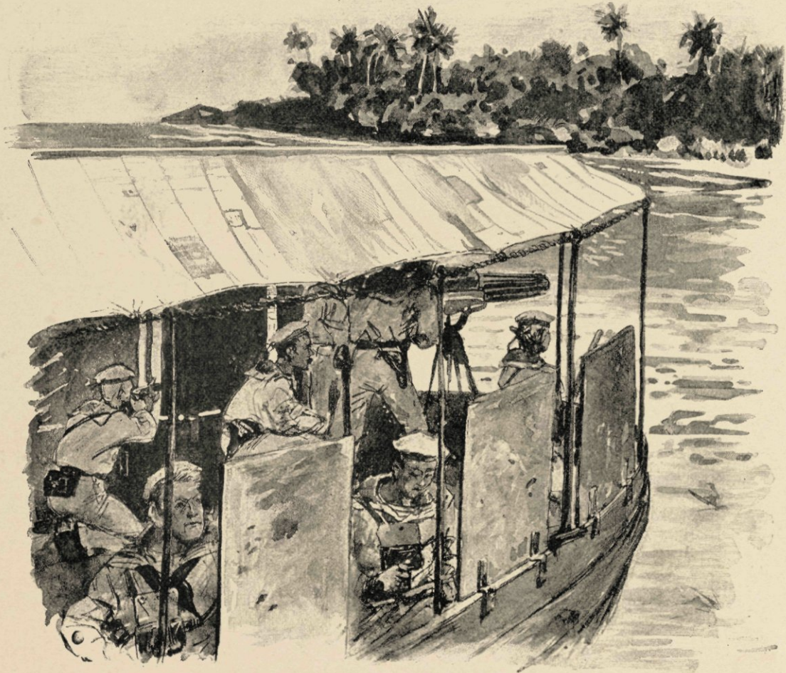
Met het geweer in den aanslag.

komt zelfs geheel boven en loopt naar het water toe, om ons eenige mooie scheldwoorden toe te zenden. Hij heeft evenwel nu voor het laatst op de Hollanders gescholden, want een scherpschutter, een marinier te klasse, zend hem nog even een schot na, dat hem blijkbaar in de volle borst treft. Met een rauwen gil stort hij voorover, en slaat met zijn uitgestrekte armen