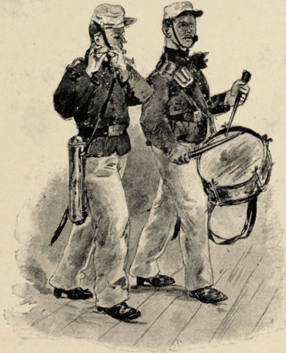
Met den tamboer en pijper aan 't hoofd.

De overste en de andere officieren, die nu aan dek zijn gekomen, om van de frissche avondlucht te genieten, hebben met den langen kijker het vuur-