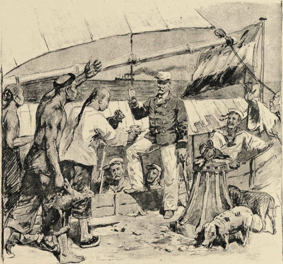
En in zijn handen een drietal kippen en een kop gloeiende thee.

Aan boord terug gekomen, wordt het proces-verbaal van de inspectie ingeleverd, daarna van tenue verwisseld na den warmen tocht, en dan een partijtje georganiseerd. Het speel- en bitteruurtje schijnt echter van daag ook