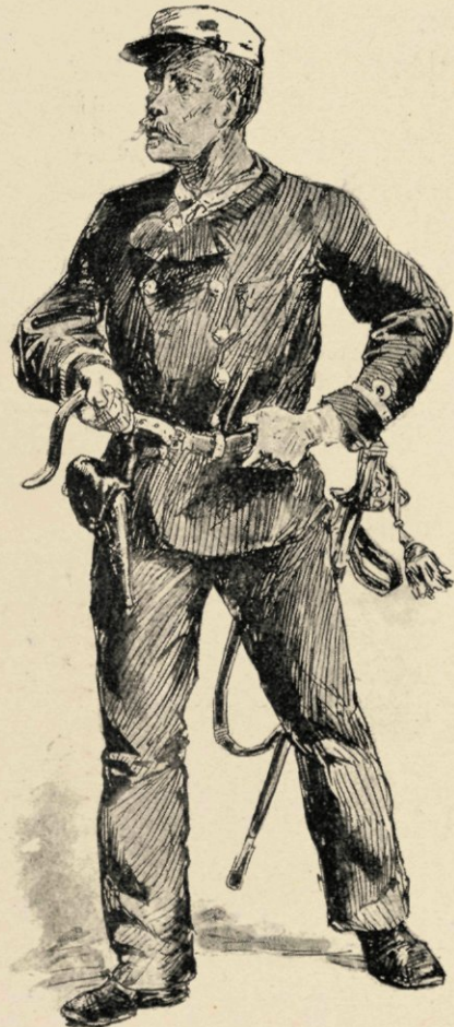
De revolver onder het loopen omgegespt.

Onder het kleeden wordt er natuurlijk wat gemopperd, doch dat is Indisch, en het is zoo heerlijk frisch aan dek, en het schemert reeds zoo