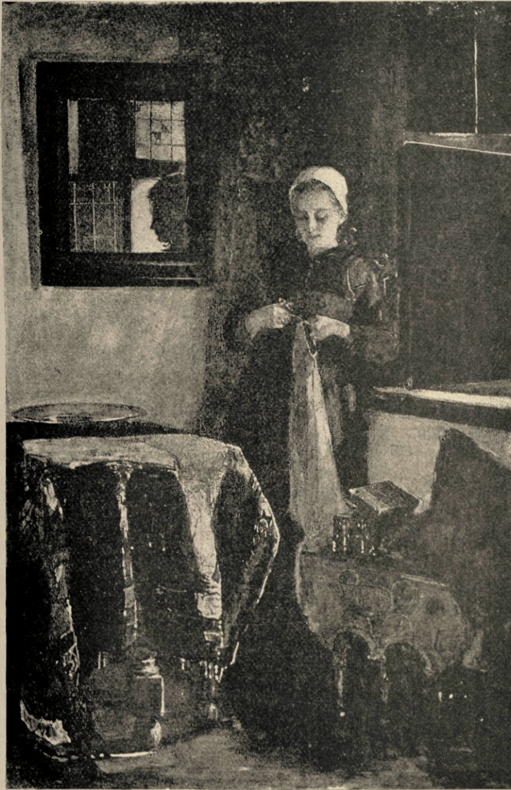
Het zonnige hoekje.

natuur dan die van ons vaderland, dikwijls de gasten van hen, bij wie Koningin Sophie hen had ingeleid; zoo vertoefden zij bij den Hertog van Saksen-Weimar in het lie-