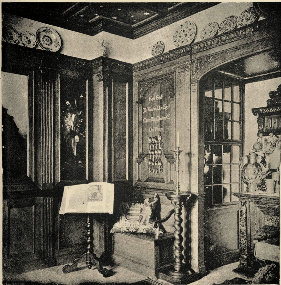
Uit de Huiskamer.

In het jaar 1855 keerde Bisschop naar den Haag terug en vestigde zich daar, met zijne moeder, in de Boekhorststraat; zijn intérieur droeg daar al