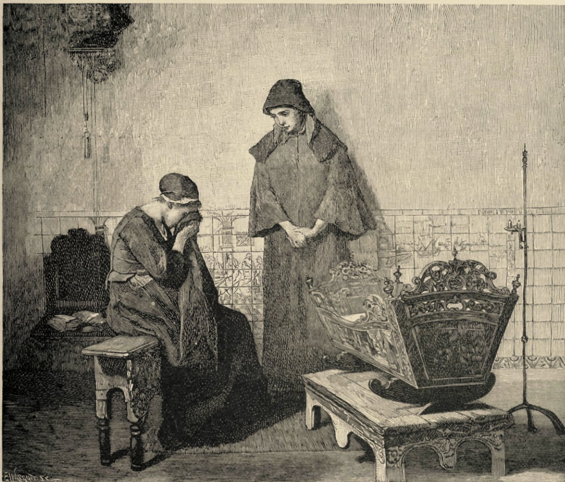
De Heer heeft gegeven, de Heer heeft genomen; de naam des Heeren zij geloofd.

Daar waren naast haar, of in hare onmiddellijke nabijheid, de Hertog van Saksen-Weimar en zijne dochter Anna; ook Prins Hendrik met zijne Gemalin.