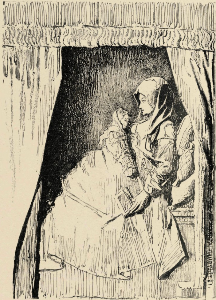
Maria met 't Kindeke. (Houtsnijwerk 16e eeuw).