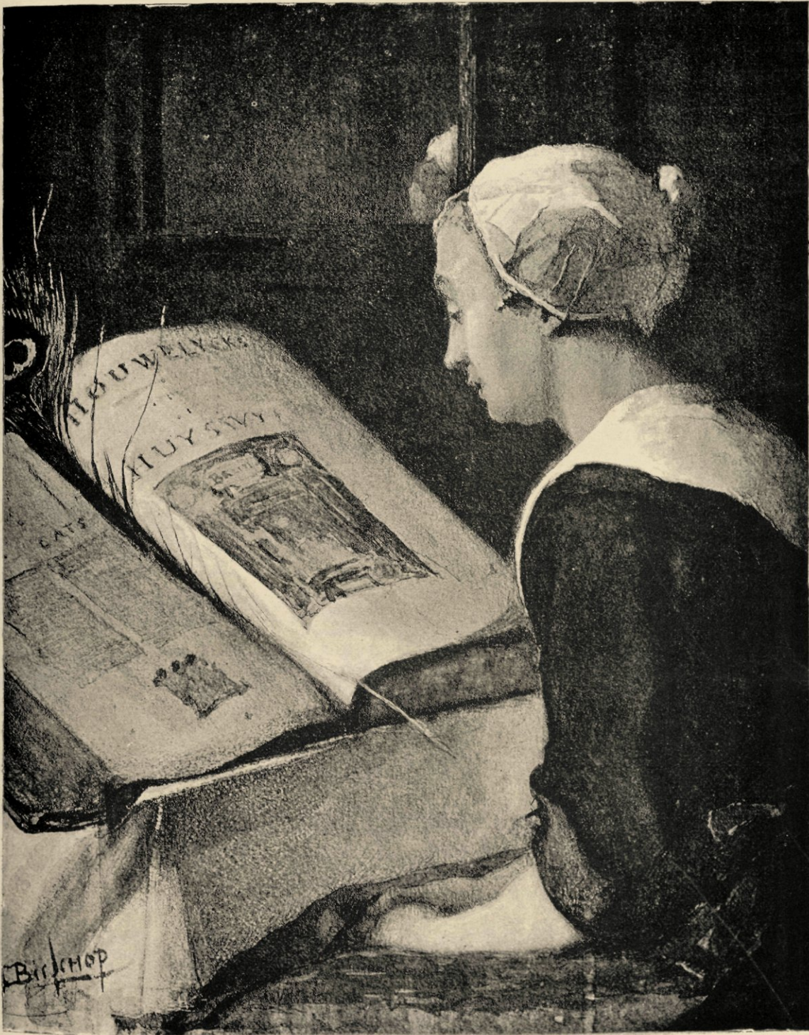
Studie in Cats Houwelyck.

Onder de velen die Bisschop bewonderden en wier bewondering hij hoog waardeerde, was bovenal Sophie, de eerste Gemalin van Koning Willem III.