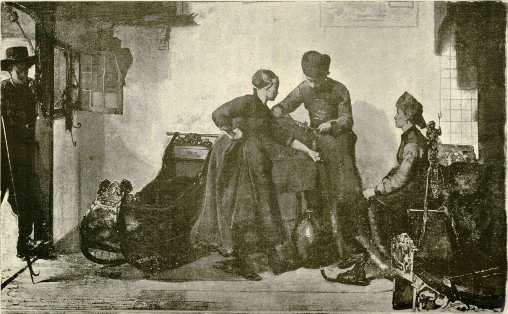
Winter in Friesland. (Rijksmuseum te Amsterdam).