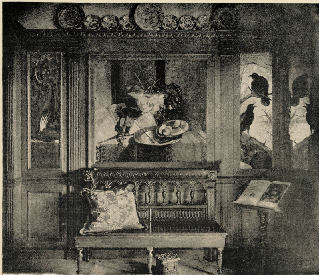
Hoekje uit de Eetkamer.