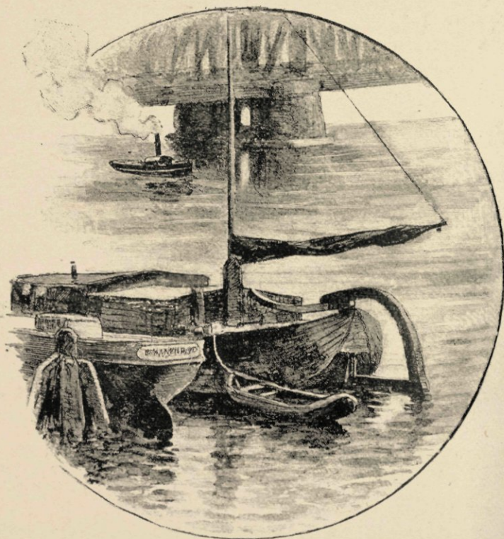
Hoekje bij de Maasbrug.

Helaas! dat hier die grootsche aanblik door twee bruggen moest ontsierd worden. Eén hooge, gewelfde brug staat goed; zij lijkt een ijzeren band, die het verkeer tusschen de twee oevers onderhoudt. Maar twee! Eerst de zeer hooge, vijf bogen lange spoorbrug, met de breede onwrikbare steenen pijlers in den Maasbodem geworteld, een trotsch gezicht, als de zware treinen onder hare welvingen donderen en de schepen met rechtopstaanden mast onder hare strekking voortzeilen. Maar dan — op een kleinen, hoogst willekeurigen afstand een andere brug, zonder bogen, aanmerkelijk, hoewel alweder een willekeurig aantal meters, lager, die het geraamte van een tunnel schijnt en een lachwekkenden indruk maakt door haar pralend optreden naast de zuster, wier paden slechts het metalen rad betreedt, geen menschenvoeten, geen luidruchtig schellende paardentram, geen lompe sleeperskar, geen kinderachtige handwagen. Medelijdend ziet zij neer op de kokervormige Willemsbrug; toornig soms, als zij een eind verder, op Feijenoord, in de Koningshaven, gedwongen wordt hare flanken na die der voetbrug te openen om vaartuigen door te laten, die