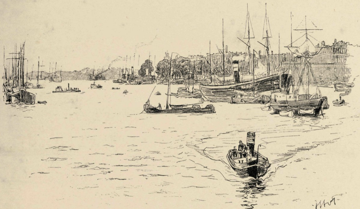
Gezicht van de Maasbrug.

Men heeft aan de westzijde der voetgangersbrug een beschot geplaatst, tegen de windvlagen; zeer misstaand voor wie zich op het midden voortbeweegt, maar van groote waarde voor wie het voetpad rechts kiest. Want daardoor is men weliswaar van al wat oostwaarts zich uitstrekt afgesloten, maar die afsluiting schijnt het schouwspel naar het westen nog verhevener en heerlijker te maken. Op dat voetpad halverwege stilstaand kan men den blik naar alle zijden laten rondwaren. Rechts de rumoerige Boompjes, met hoopopgestapelde goederen en zwarte krioelende werkmieren op, langs, achter de hijgende, stoomende schepenrij, links de kade van Feijenoord, nog niet geheel dichtge-