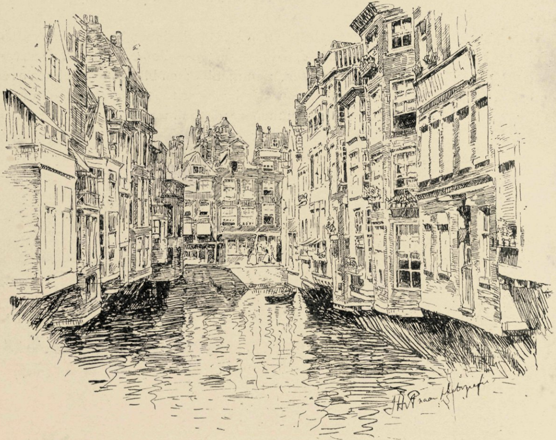
Gezicht op het Steiger.

Men keert de brug den rug toe en wandelt verder langs de Boompjes, aan den Maaskant. De schepen, die hier in- en uitladen zijn zeer verschillend, meest Engelsche booten, maar toch ook vele vrachtschepen voor binnenslandsch verkeer, eenige Oostzevaarders, waarvan sommige met hun afgeplat achterdek en aangelijsden boegspriet doen denken aan de allerliefste driemas-