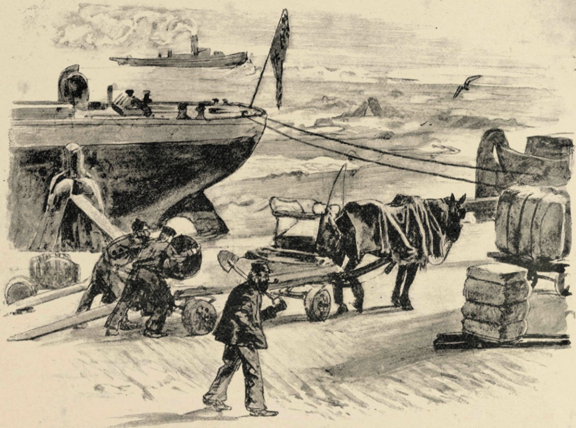
Sjouwers aan den arbeid.

schepen aan den kant, voortdurend sissend, lossend en ladend. Groepen van schepen, meestal een groote driemaster met geelgerookte stoompijp aan het hoofd, in het midden der rivier; daaromheen andere kleinere stoomers of lange, platte, breede aken en Rijschepen, op slakken gelijkend, als eilanden onbewegelijk, muurvast in het stroomende water. Groote ronde boeien, hier en daar drijvend, als priktollen, met een kolossalen ijzeren ring om ze te hanteeren, deinen zonder van plaats te veranderen op den golvenden stroom. Als had een kwistige hand ze losje erover uitgestrooid, dringen, schuiven, snijden overal kleine sleepbootjes met korte, zenuwachtige machinestooten, tusschen de