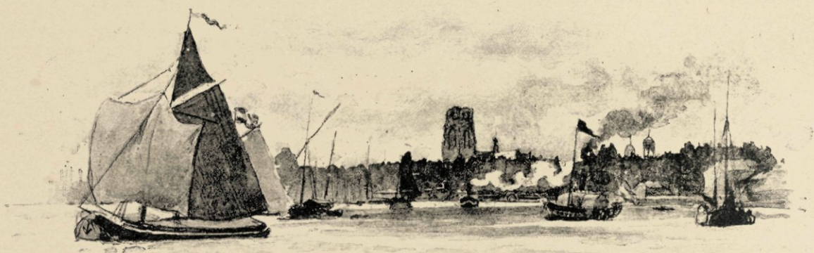
Op de rivier.

Dan, als wilde de stad de rivier zoolang mogelijk aan hare zijde doen toeven, heeft zij nog dien uitgestrekten tuin langs den oever geplant, bij den vreemdeling als het Tollenspark, bij den stedeling nimmer anders dan als