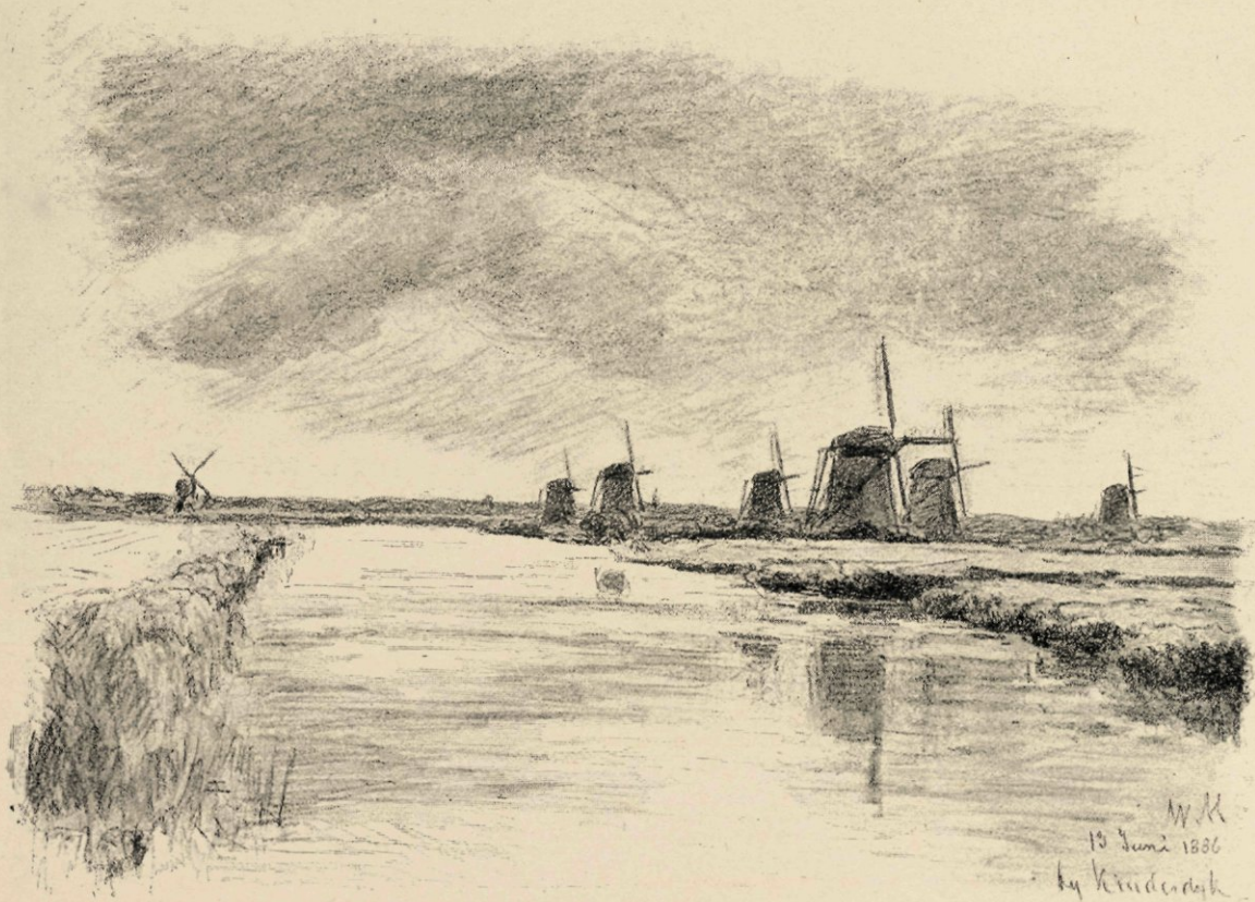
Bij de Kinderdijk.

Uit dat alles valt te leeren, dat hij gewild heeft: een dichterlijke, tevens artistieke opvatting van het landschap, vrij van die abstracte kunst, waarin