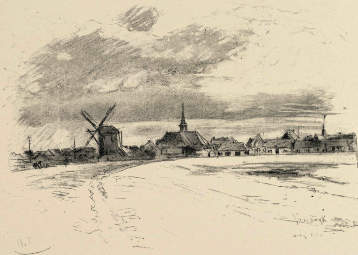
Vreeswijk aan de Lek.

En het middel, om u de illusie te geven, dat gij zijt, waar hij was? Het geheim van een kunst, die u een ontvangen indruk juist en krachtig weergeeft? Allereenvoudigst: te maken, wat men ziet. Deze formule is kort, maar zegt veel. Want Roelofs verstaat hieronder een zeer stellig gebod om niet halverwege het werk neer te leggen, in de hoop, dat „het 't zoo ook wel doen zal.” Even wars als hij is van de slecht-begrepen uitvoerigheid, die in