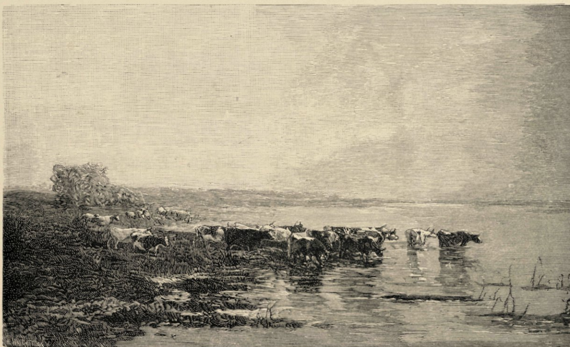
«Aan de Rivier,» naar eene aquarel in het bezit van den graaf Duval de Beaulieu te Brussel.

Schilder wordt men uit vocatie, en het is geen zware plicht te werken, wanneer het werk zelf een plezier is; toch dwingt ons die onvermoeidheid, dat voortdurend zoeken, die rustelooze drang naar een juister weergeven,