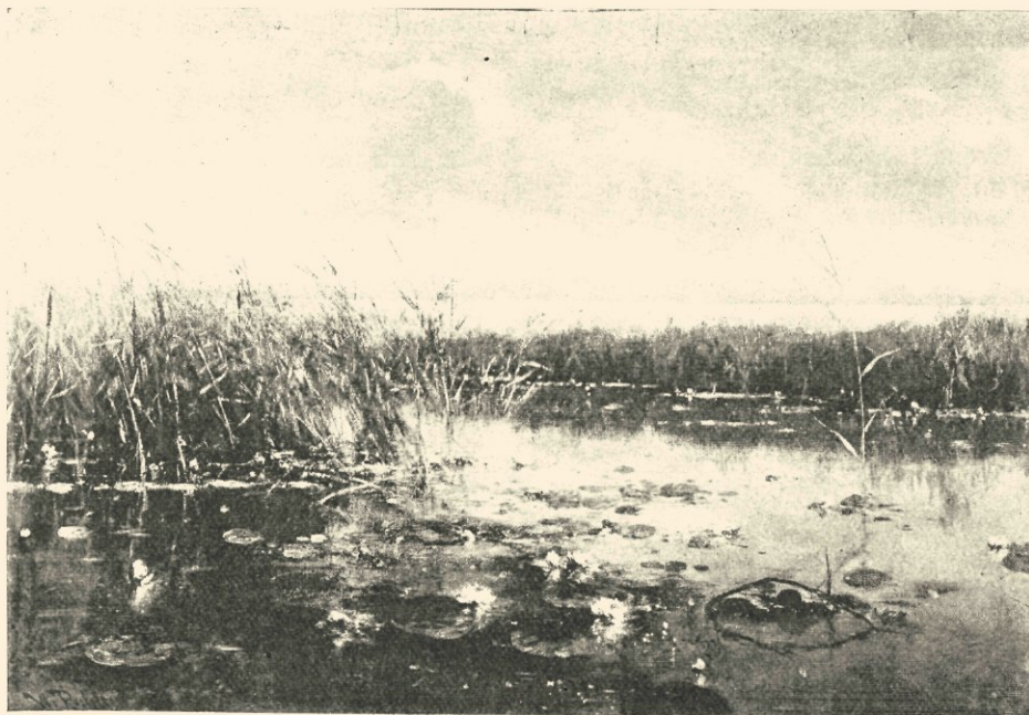
Plas te Noorden, naar eene schilderij in het bezit van Mr. J. Jochems.

„beesten” er bij gekomen; uit dezelfde periode dateeren de plassen (de Waterlelies), uit een vroegere de eiken. Maar eiken, plassen of beesten, het is altijd „gezien,” op heeterdaad betrapt; het is geschilderd in het goede ge-