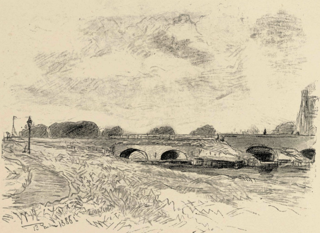
Sluis aan de Kinderdijk.