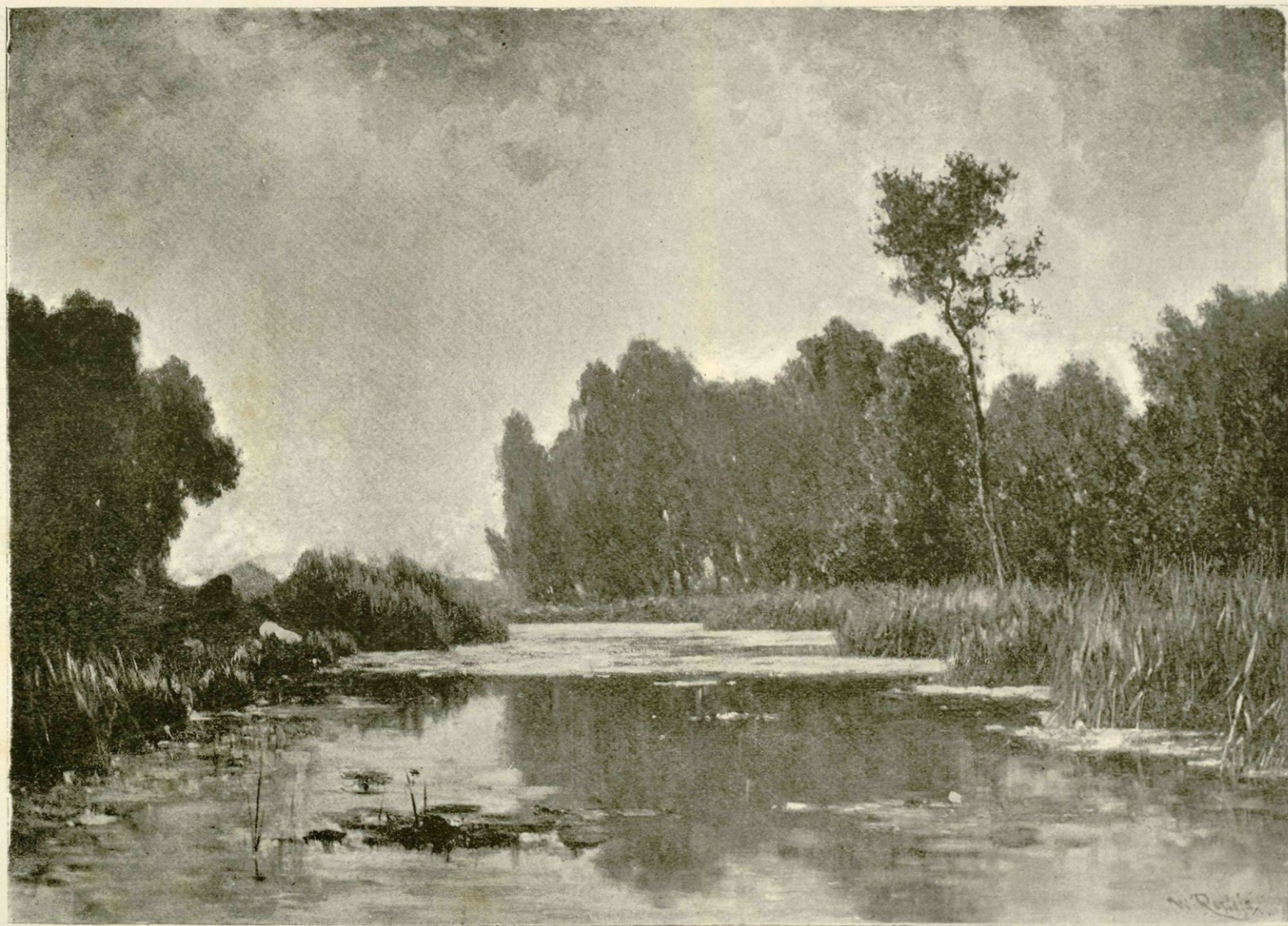
« Het Gein, » naar de schilderij van het Rijksmuseum te Amsterdam.