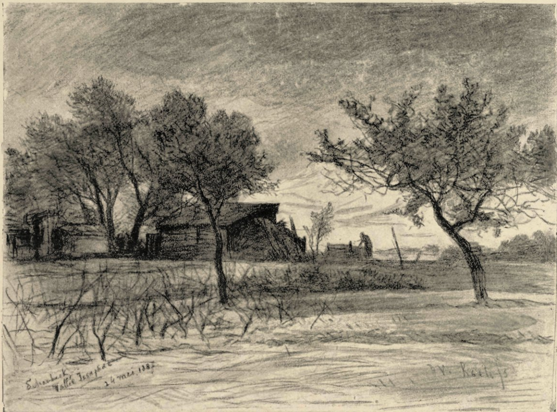
Schaarbeek bij Brussel.

Heel eenvoudig en van zelf sprekend schijnt dit alles ons thans, nu de tentoonstellingen ons jaarlijks zooveel honderden „hollandsche landschappen"