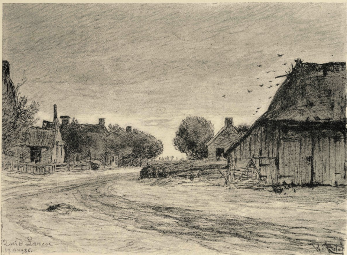
Zuid Laren (Drenthe).

Zijn verblijf in Brussel was nog in een ander opzicht van groot belang. Hoewel hij in Fontainebleau, ook in de Campine, veel schilderde, kreeg hij een zekeren weemoed naar „de plek,” waar ook zijn „wieg eens stond.”