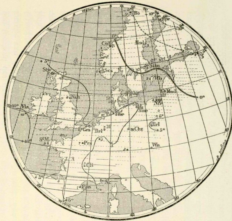
Temperatuur en neerslag.