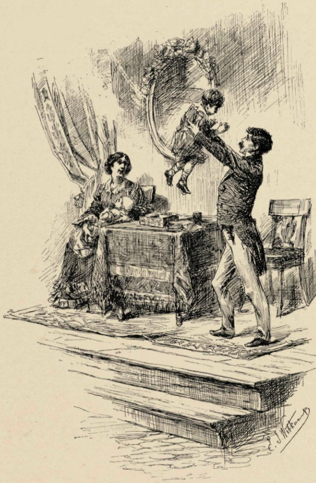
Jan springt op van zijn stoel met Jantje in de armen.

Jan springt op van zijn stoel met Jantje in de armen; hij slaat door het voorportaal een paar danspassen tot verbazing van die bezoekers, die niet kunnen vermoeden, waarom de man, die straks zoo druilloorig met zijne kinderen zat, thans zoo vroolijk rondspringt.