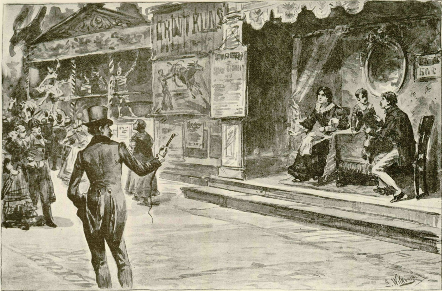
De jonker van Porkema wandelde weder voorbij.