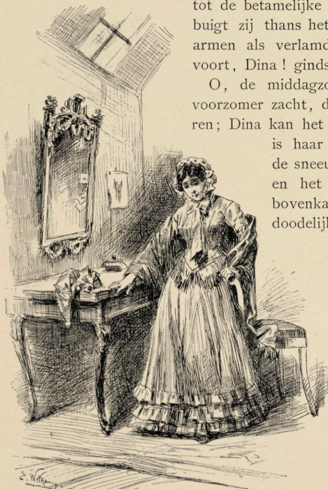
Waarom buigt zij thans het hoofd voorover.

dit voorschrift acht uur ongeveer in den avond geweest zijn — maar zij moet van uur tot uur een poeder innemen. Kan dat nog gebeuren, sterft zij in dien nacht niet, maar vervalt zij tegen den morgen, om drie of vier uur in eene lichte sluimering en begint zij zachtjes aan uit te wasemen, dan