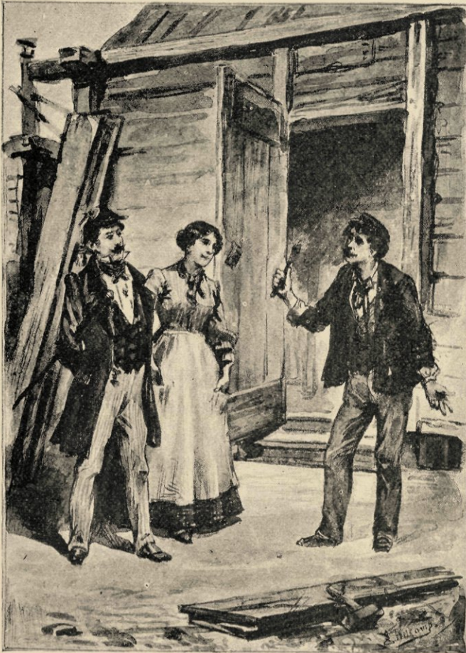
«Goddank!» zei de spulleman en lei zijn verfkwast neer.

„'t Is prachtig!” verzekerde de student schaterlachend: „maar zijt ge dol, kerel! om op dien steek eene oranjecarde te plakken?”