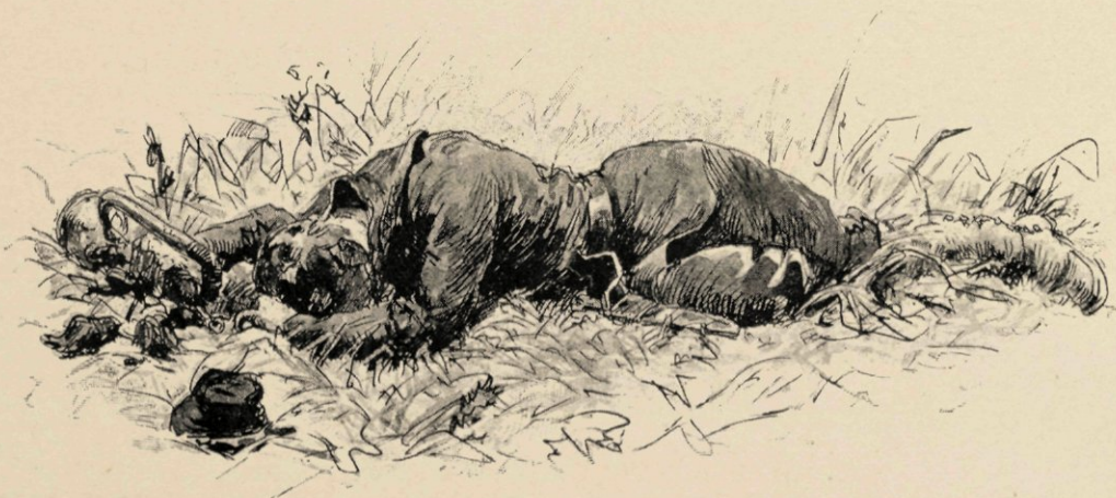
Bewegingloos lag de arme strijder op den grond.

Na een oogenblik rust werd de marsch naar Senangri voortgezet. Den