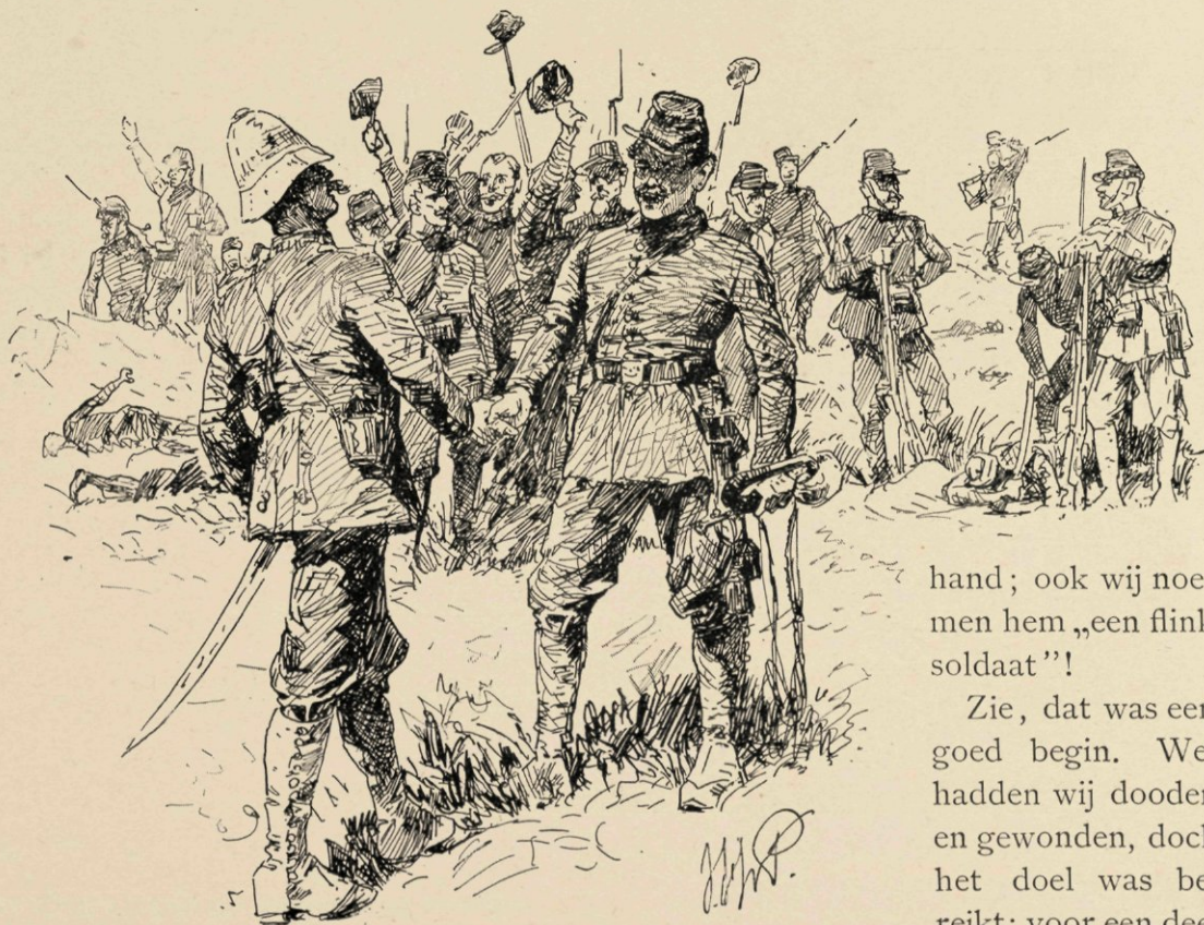
Toen luitenant Mollinger Zwaan de hand drukte.

Ook wij wenschen hem geluk; ook wij drukken hem in gedachten de