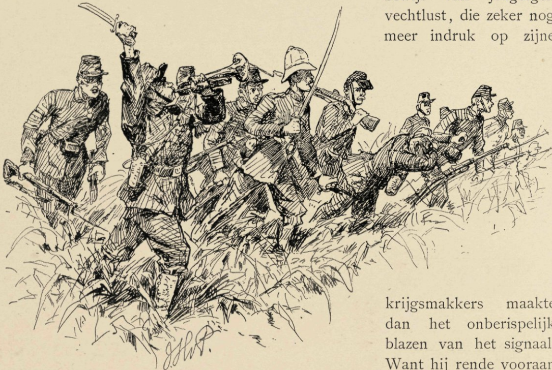
« werd het signaal attaqueeren geblazen. »

zijne heldere tonen het troepje aanmoedigde, gaf tevens een schitterend bewijs van jeugdigen vechtlust, die zeker nog meer indruk op zijne