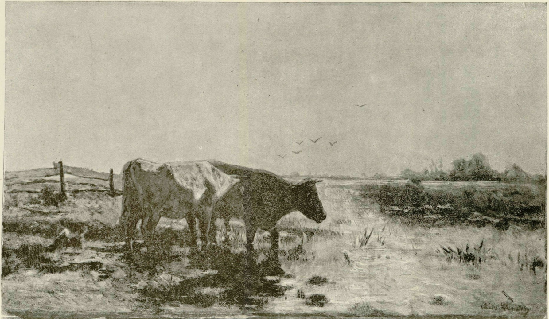
Een warme dag, naar eene schilderij in Dordrecht's Museum.