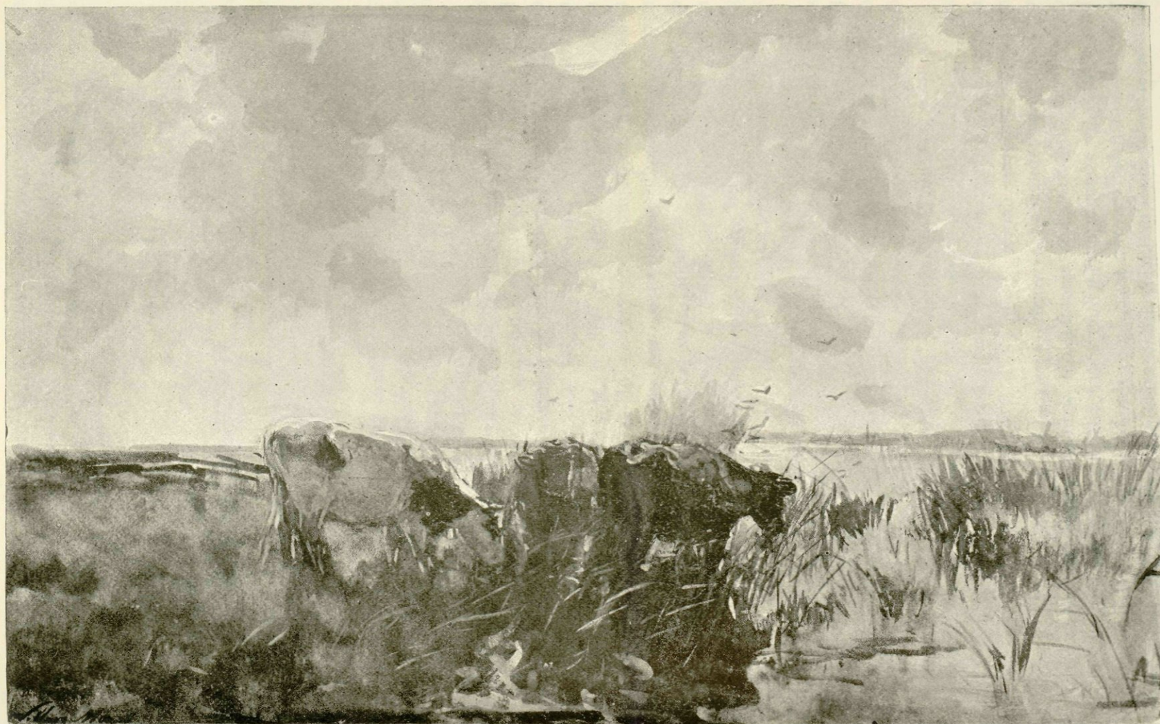
Aan den plas, naar eene aquarel.