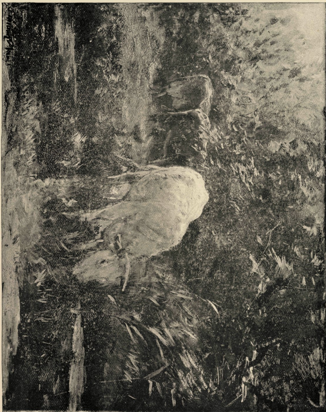
« Drinkende koe », naar eene schilderij in het Rijksmuseum.

In dat schildertje is de invloed van de kleur van lucht en weide op de koeien nog bijna geheel verwaarloosd; die heerlijke warme atmosfeer die Willem Maris nu zoo tot in volkomenheid weet uit te drukken ontbreekt geheel, toch kan men in het witte koetje reeds den toekomstigen kolorist