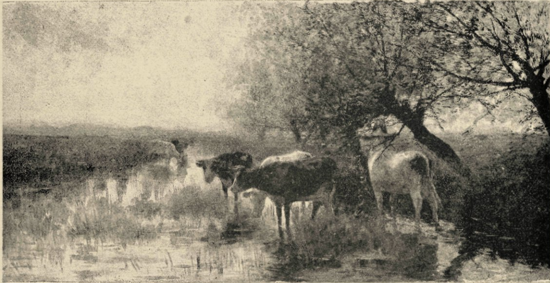
Onder de wilgen, naar eene schilderij.

En het geheel voor oogen houdend, schildert hij alles daaraan ondergeschikt. Zijn door het sterke licht, achter de figuren, de détails der gezichten weggevaagd, zijn de omtrekken der voorwerpen vervloeid in atmosfeer, of zouden te veel kleinigheden schaden om de verlangde grootschheid aan het