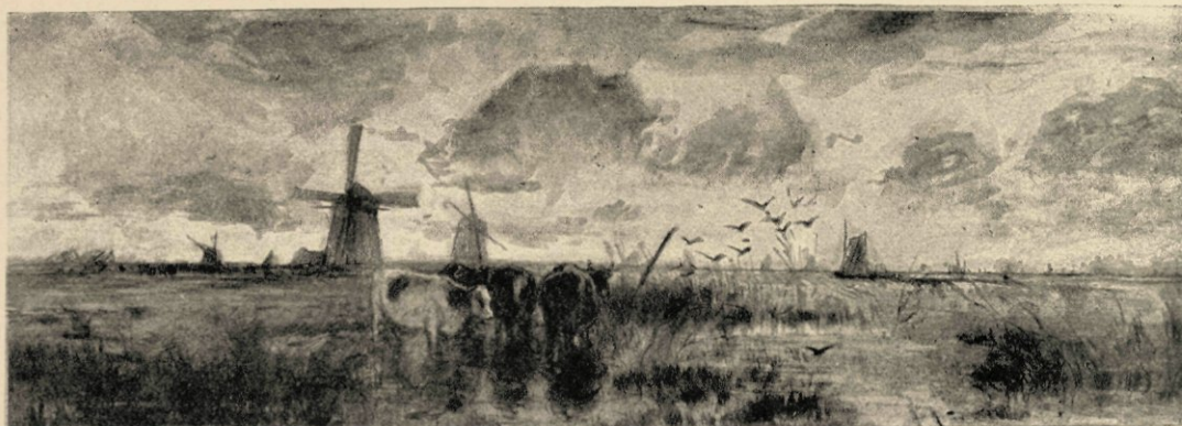
Aan de rivier, naar eene houtskoolteekening.

Zij die beweren dat Willem Maris niet teekenen kan, zouden dan zeker