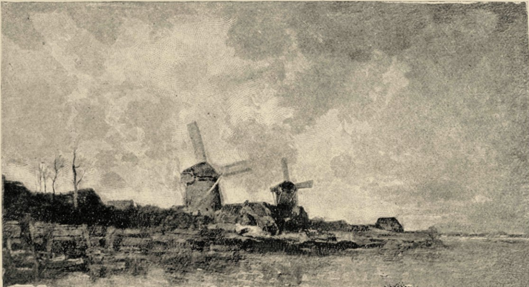
De twee molens, naar de schilderij in het bezit van den Heer J. S. Forbes te Londen.

Daardoor behoudt hij nevens zijn verbazende kracht, toch altijd dat naïve en teedere, dat aan zijn werk die groote bekooring verleent.