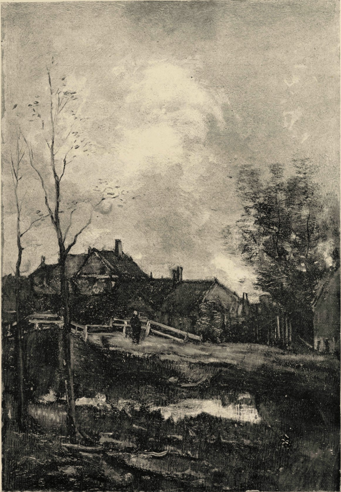
Bij Delft, naar de schilderij in het bezit van Mevrouw H. G. Tersteeg.