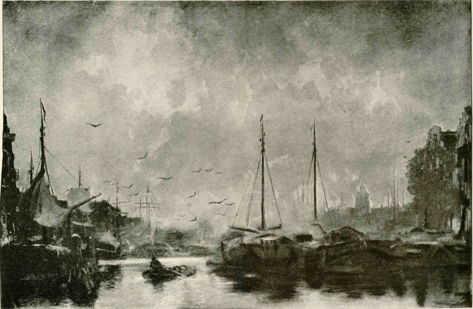
Stadsgezicht, reproductie naar de schilderij van Jacob Maris, in het Rijksmuseum te Amsterdam.