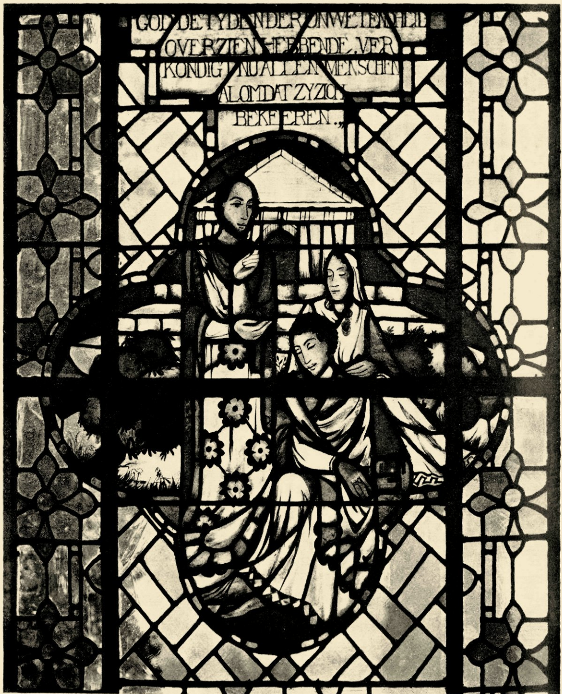
Gedeelte van het raam „Paulus op den Areopagus”.